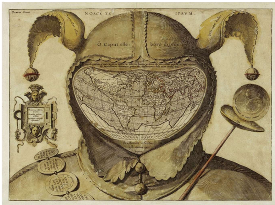
Tableau 3: O caput elleboro dignum , vers 1590, Exposition "La figure du fou", Musée du Louvres, 2025

Dans cette estampe, la conception néo-victorienne de la folie est parfaitement résumée : la figure emblématique du fou, reconnaissable à sa marotte et à son bonnet à grelots est remplacée par une mappemonde, suggérant son universalité. Elle se retrouve aussi dans le titre de l'œuvre, « O caput elleboro dignum », ou « monde dans une tête de fou », insinuant que la folie est partout, mais surtout qu'elle voyage et qu'elle conquiert le monde, et ici en l'occurrence, les autres personnages des œuvres.