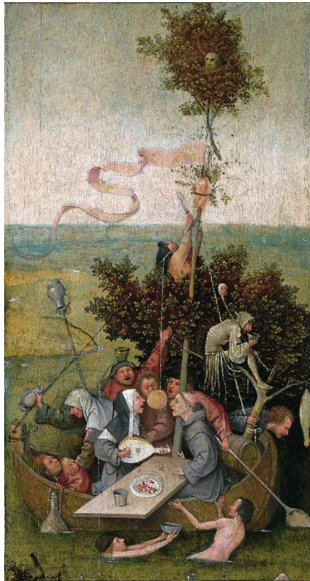
Tableau 2: La Nef des Fous, Jérôme Bosch, 1490-1500, musée du Louvre

Mémoire présenté en vue de l'obtention du Master Etudes Culturelles, Parcours Monde Anglophone