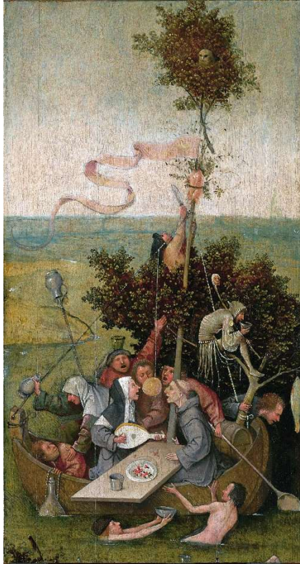
Tableau 1: La Nef des Fous , Jérôme Bosch, 1490-1500, musée du Louvre

Mémoire présenté en vue de l'obtention du Master Etudes Culturelles, Parcours Monde Anglophone