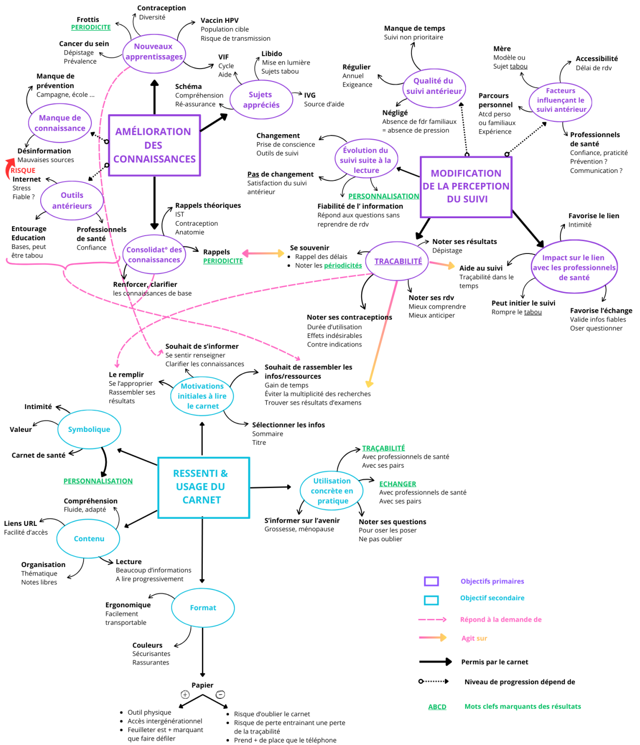
Figure 2. Carte heuristique (mind-map) schématisant les résultats.