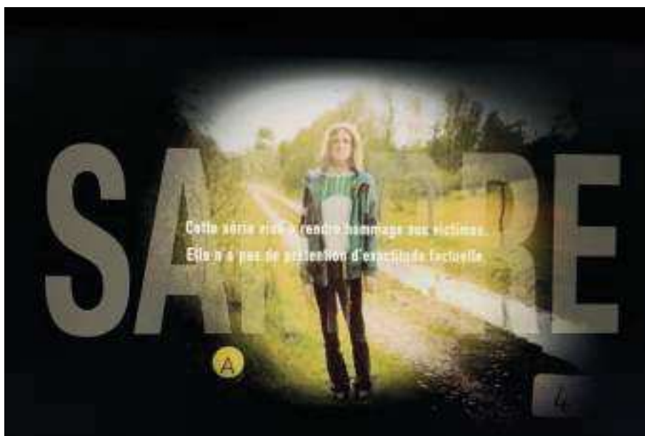
Paratexte introduisant le générique de fin

Chaque épisode de Sambre se clôture par l'inscription « Cette série vise à rendre hommage aux victimes. Elle n'a pas la prétention d'exactitude factuelle ». Dans son ouvrage Seuils , théoricien en littérature française Gérard Genette explore la notion de paratextualité, c'est-à-dire tous les éléments périphériques à un texte littéraire, qui permettent sa présentation, son interprétation, et son insertion dans l'espace littéraire. Il désigne paratexte « ce par quoi un texte se fait livre et se propose comme tel à ses lecteurs » 18 . Dans le cas de Sambre , le paratexte final permet d'intensifier la dimension émotionnelle et morale de l'histoire, puisqu'elle vise à susciter une prise de conscience de la réalité des faits et de leur gravité.