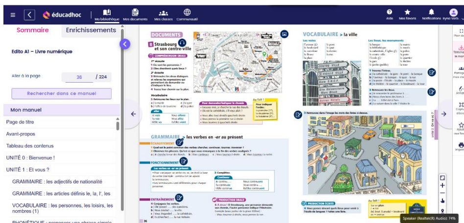
Figure 4. Interface de la plateforme Éducadhoc utilisée pendant le cours (Édito, 2016).