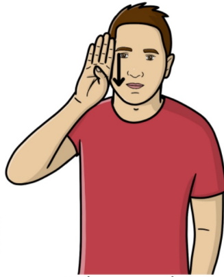
S'il vous plaît S'il te plaît