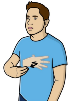
Allaiter / Allaitement