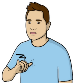
pipi / toilettes