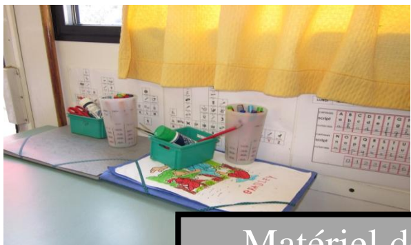
Matériel des élèves