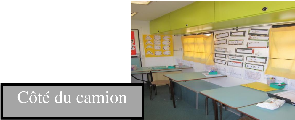
Côté du camion