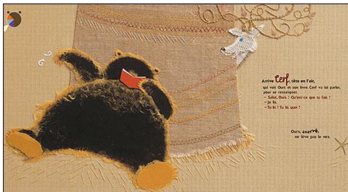
Ours qui lit – Eric Pintus (auteur) et Martine Bourre (illustrateur) Ours allongé sur le dos, près d'un arbre, qui permet l'identification de l'enfant et met en abyme sa propre posture de lecteur

Enfin, dans l'album Non, non et non ! (Ecole des loisirs, 2002) de Mireille d'Allancé, les ours sont habillés, ils portent également des noms communs généralement associés au genre humain, comme Octave par exemple, et utilisent les appellations communes « Maman » et « Papa ». Le caractère anthropomorphique de l'ours est ainsi souvent utilisé, dans la littérature de jeunesse, pour permettre une lecture d'identification, gratifiante et plaisante.