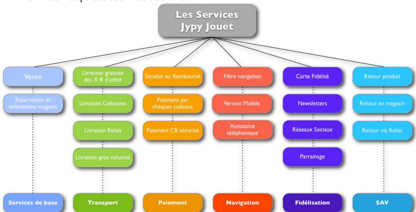
Illustration 3 : Les services jypy-jouet.fr

Le site proposera une variété de services intéressante pour son lancement. En effet, les clients sont très regardants sur les points qui simplifient leurs achats et leurs donnent plus de libertés. Voici donc un schéma des services qui seront mis en place et qui représentent les services indispensables à l'heure actuelle.