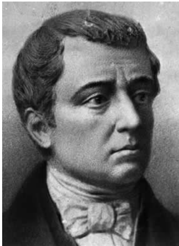
Mariano Moreno (1778-1811), secrétaire de la Première Junte révolutionnaire et fondateur du premier journal des Provinces Unies du Río de La Plata

Lecture du Bicentenaire de la Révolution de mai 1810 : Les représentations de la construction et de l'identité nationale en Argentine à travers une analyse de contenu de presse de trois quotidiens de Buenos Aires (mai 2010) : La Nación , Clarín et Página/12