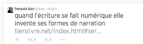
Tweet de François Bon, @fbon sur Twitter.

Comme dit précédemment, la contrainte de ce réseau social est l’obligation d’écrire sous un certain format : un tweet c'est-à-dire un texte posté sur Twitter ne peut dépasser les 140 signes. Il faut donc savoir jongler avec ce nombre de caractères, cibler son message tout cela dans l’optique de se faire comprendre et communiquer.