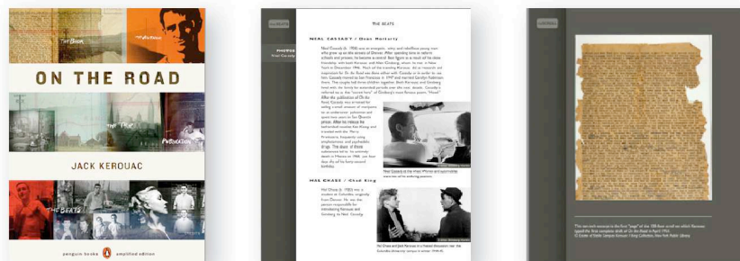
Jack Kerouac, Sur la Route (A Penguin Books Amplified Edition).

Ou encore le livre à succès de Jack Kerouac, Sur la Route :