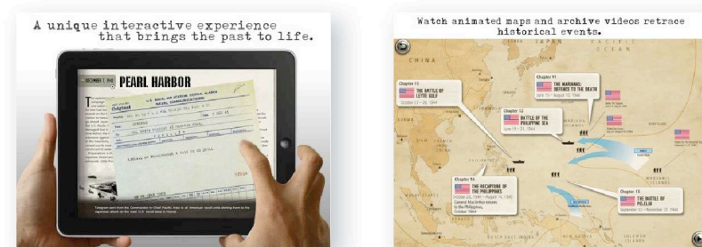
War in the Pacific : le livre interactif de Gameloft.

Les différents exemples ci-dessous le prouvent :