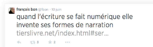
Tweet de François Bon, @fbon sur Twitter.

Comme dit précédemment, la contrainte de ce réseau social est l’obligation d’écrire sous un certain format : un tweet c'est-à-dire un texte posté sur Twitter ne peut dépasser les 140 signes. Il faut donc savoir jongler avec ce nombre de caractères, cibler son message tout cela dans l’optique de se faire comprendre et communiquer.