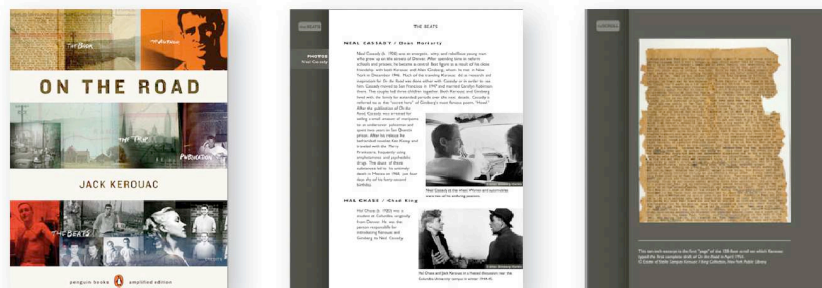
Jack Kerouac, Sur la Route (A Penguin Books Amplified Edition).

Ou encore le livre à succès de Jack Kerouac, Sur la Route :