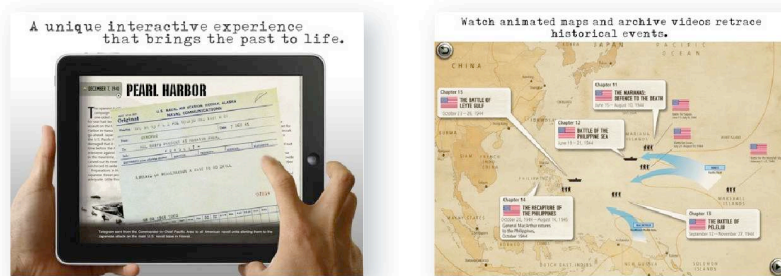
War in the Pacific : le livre interactif de Gameloft.

Les différents exemples ci-dessous le prouvent :