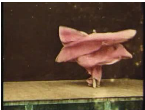
Loïe Fuller, Danse Serpentine, 1896

Par ces geste dansés, qui « moulent » l'espace objectif, le danseur « secrète réellement un espace spécifique », espace poétique du corps « si bien que l'œil du spectateur ne voit plus que les formes créées par la danse » 28 . Grâce au déploiement des forces 29 et du sens portés par le geste dansé, la danse ouvre un espace poétique dans l'espace objectif.