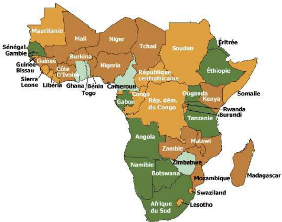
Figure 3: Carte de l'Afrique Subsaharienne.