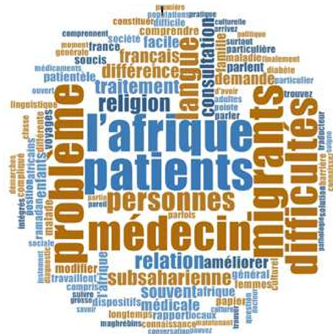
Figure 2: Nuage des mots les plus fréquents, issus de Nvivo 10