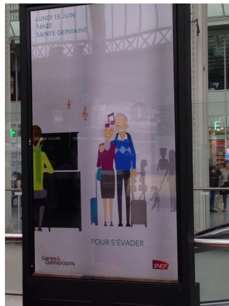
Paris gare de Lyon, le 15 juin à 16h22

Les personnes interagissent donc avec les textes, derrière lesquels se cache l'institution, comme dans les non-lieux de Marc Augé. Toutefois, les personnes n'interagissent pas qu'avec ces textes, ces images, comme le montrent les nombreuses fois où le dialogue est engagé autour du piano. Les non-lieux construisent un homme moyen, semblable à l'autre, et sans identité singulière. Au contraire, l'espace autour du piano polarise presque deux catégories de personnes, à savoir celles qui savent jouer au piano et celles qui ne savent pas. Ainsi, les personnes qui jouent bien au piano se différencient du tout venant, acquièrent une identité bien singulière si bien qu'après avoir joué, les passants s'intéressent à