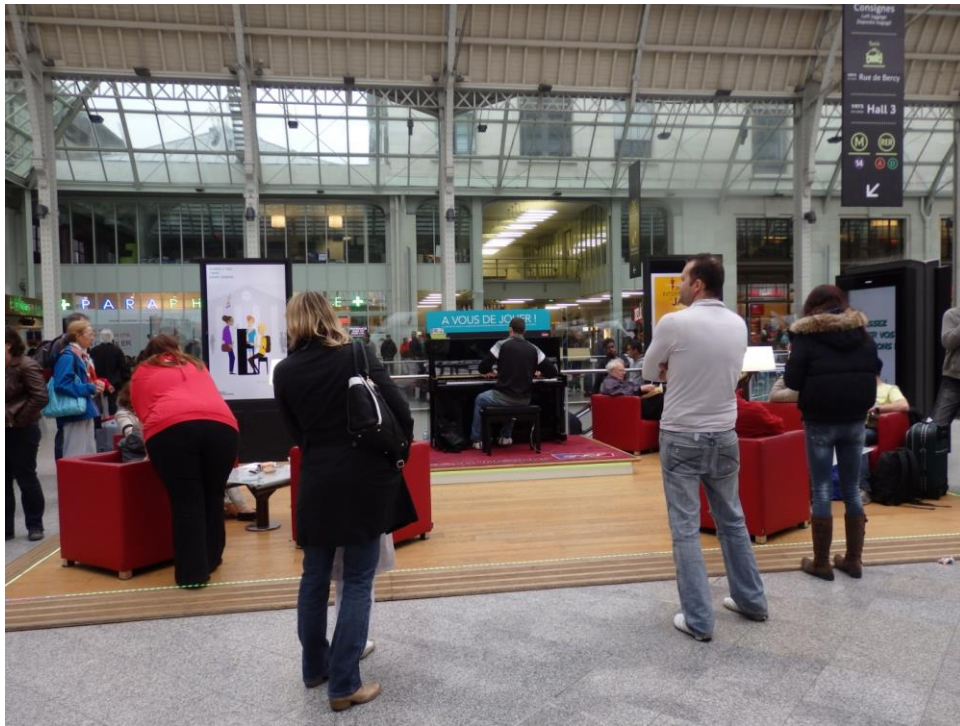
Photo prise par Victoire Dupont à Paris Gare de Lyon le 1 er mai 2015