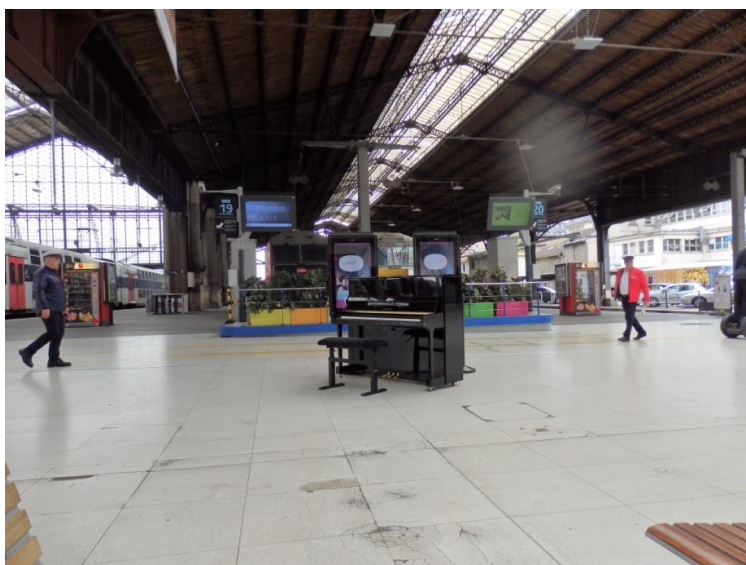
Paris gare d'Austerlitz, lundi 4 mai, 12h10

Or, cette mise en scène est une spécificité de Paris gare de Lyon, contraste par exemple avec la gare d'Austerlitz ou de Bercy :