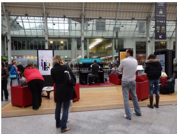
Paris Gare de Lyon, samedi 2 mai, 15h30

l'expérience sociale qui nous permet de comprendre ce qui nous arrive et d'y prendre part. Un cadre structure aussi bien la manière dont nous définissons et interprétons une situation que la façon dont nous nous engageons dans un cours d'action 125 . » Ainsi, le cadre induit les perceptions des situations et les comportements adaptés. Ici, le cadre, dans le sens de l'aménagement du lieu, se veut différent du reste de la gare, ce qui entraîne des appropriations spécifiques. Deux estrades en parquet sont posées, une pour accueillir le piano, et une autre les sièges. Les sièges rouges, les tables basses et les lampes apportent une ambiance différente à ce lieu. Un tapis est posé sous le piano, selon la photo ci-dessous :