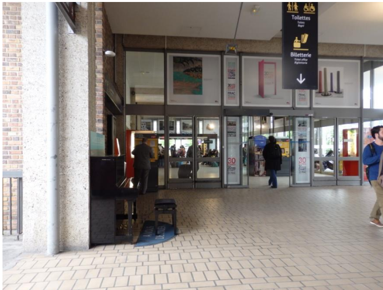
Paris gare de Bercy jeudi 7 mai, 9h15

L'aménagement du piano à Paris gare de Lyon se veut joli et confortable. Il tranche avec l'aménagement du reste de la gare sans parquet ni tapis, ni sièges dédiés. Cet aménagement spécifique est noté par les passants interrogés. Un d'eux se rappelle même de la période où cet aménagement a été installé : « depuis Noël dernier ils ont mis des petits sièges rouges, les gens peuvent se poser ». Cette mise en scène est spécifique à Paris gare de Lyon, et peut influencer l'appropriation des lieux. La même personne rajoute : « Il y a vraiment une vraie disposition, c'est bien foutu à gare de Lyon. » « Même si personne ne joue, c'est confortable et joli », commente un autre pianiste avec enthousiasme. La présence de sièges vus comme confortables limite la brièveté des passages. Dans d'autres gares sans cet arrangement de l'espace, les appropriations sont sans doute différentes. L'espace prend donc un autre sens qu'uniquement celui de jouer ou écouter du piano, de par son arrangement, l'installation de jolis sièges. Il tend à ressembler à un salon de thé, ou à un petit café-théâtre. Cet argument tend à éloigner cet espace du non-lieu, au contraire de l'ensemble de la gare, vue comme peu confortable.