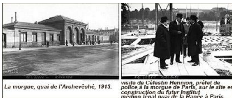
La morgue, quai de l'Archevêché, 1913.

Au XIXe siècle, la morgue prend des allures beaucoup plus organisées, voire "spectaculaires". En effet, après avoir siégé près du pont du Châtelet, la morgue s'installe en 1804 sur l'île de la Cité, dans un édifice du quai du Marché Neuf. Les corps, préparés, sont exposés en vitrine, habillés de leurs propres vêtements. La population locale défile ainsi, la journée durant, afin de les observer à loisir et, par la même occasion, tenter une identification. « C'est l'attraction du Tout-Paris, au point de figurer dans des guides de voyagistes étrangers! Cette technique est aussi favorable aux autorités qui ont bien souvent l'occasion d'arrêter les criminels revenus discrètement observer leurs "trophées" ». (L'Institut médico-légal de Paris, lieu de la dernière vérité par Sophie Farrugia).