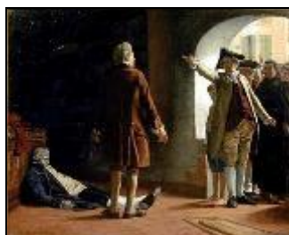
Découverte du corps de Marc-Antoine