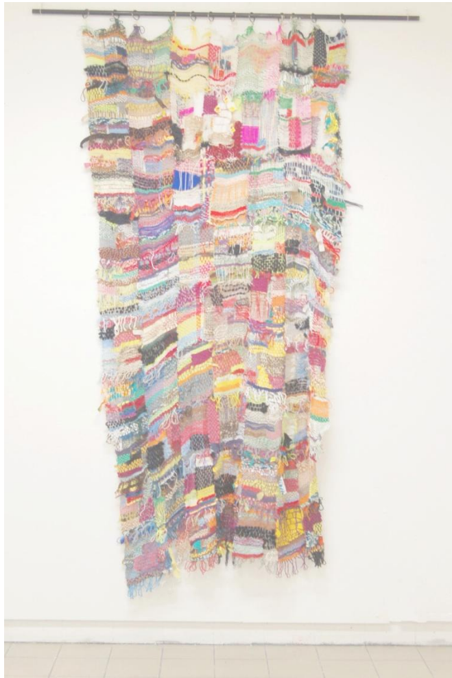
Sans titre , 2016, fils et laines tissées, 200x120cm