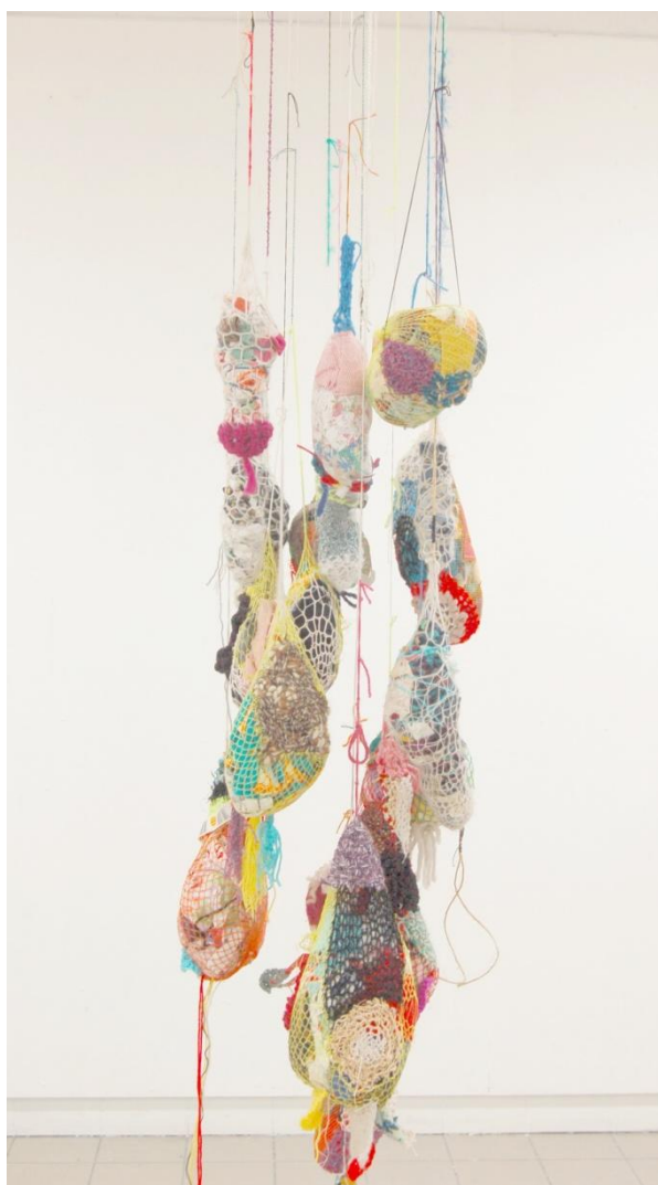
Sans titre , 2016, techniques mixtes, dimensions variées.