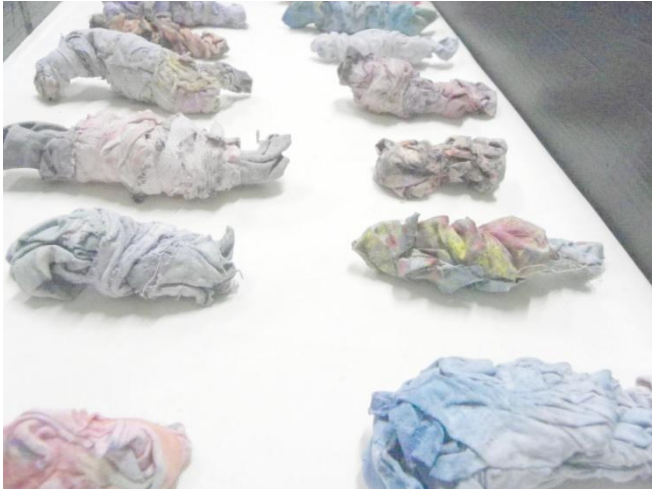
Sans titre , 2013, tissus, peinture, plâtre, 27 éléments d'environ 10x4cm