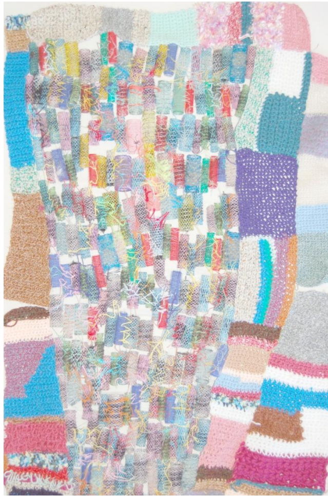
Sans titre , 2017, bigoudis, laines, fils, 100x70cm.