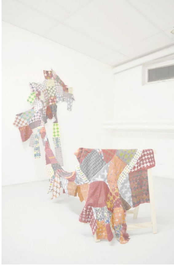
Sans titre , 2013, techniques mixtes, dimensions variées.