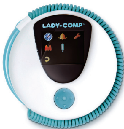
Figure 2 : Moniteur Lady-Comp

L'appareil de monitoring Lady-Comp a été choisi en exemple devant sa large médiatisation et utilisation.