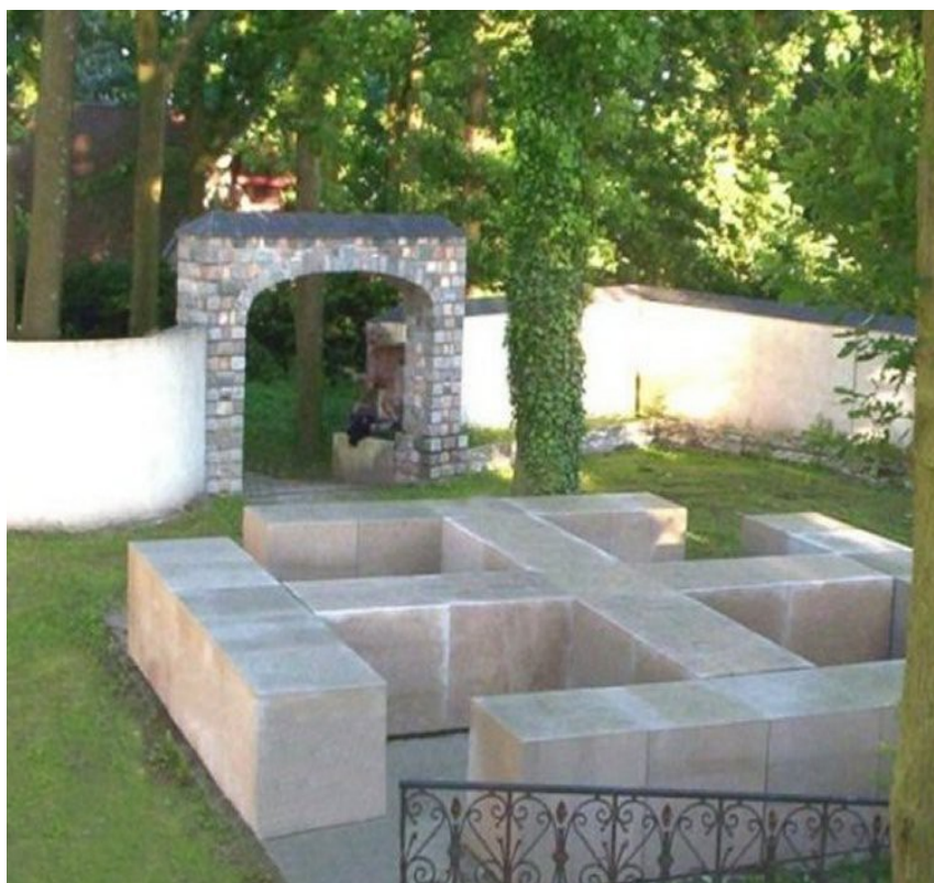
Croix potencée, symbole du scoutisme, au centre des plaques commémoratives