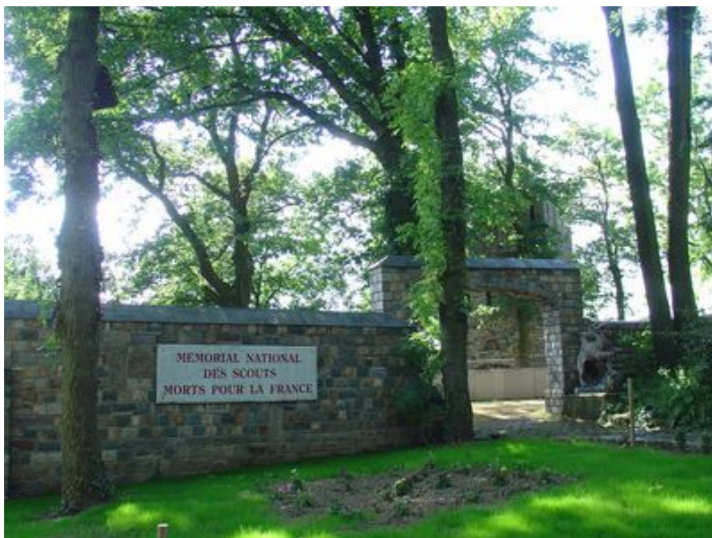
Entrée du Mémorial, à côté du monastère