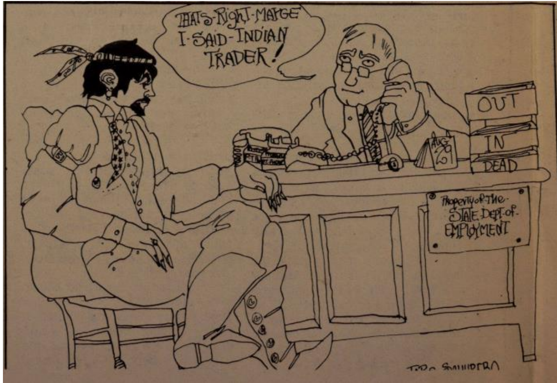
Figure 10. Dessin humoristique “Indian Trader” mettant en scène un hippie ou membre de la contre-culture en train de passer un entretien d’embauche pour un emploi “straight”, publié dans le Berkeley Barb , 3 septembre 1965, p. 2, Independent Voices, https://voices.revealdigital.com/cgi-bin/independentvoices?a=d&d=BFBJFGD19650903.1.2&e=---03-09-1965--en-20--1--txt-txIN-berkeley+barb-----1 . Consulté le 4 février 2018.