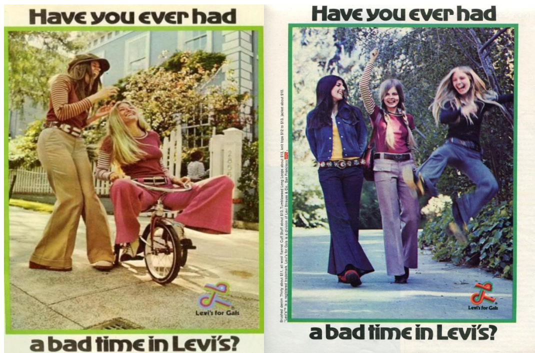
Figure 18. Publicités “Have you ever had a bad time in Levi's?” pour les jeans Levi's , dans Mademoiselle , octobre 1972.