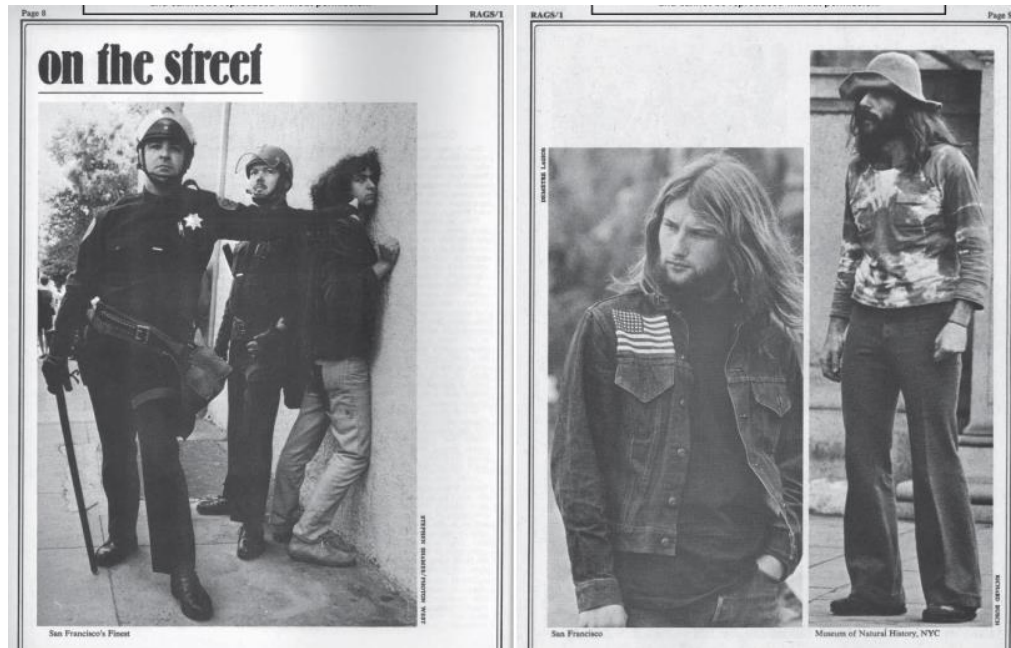
Figure 3. Photographies de hippies dans les rues de San Francisco (1 et 2) et de New York (3) pour “On the Street”, Rags magazine, San Francisco, Californie, N°1, pp. 8-9, Rags Lives, http://ragslives.blogspot.com/2006/10/june-1970-on-street.html . Consulté le 15 mars 2018.