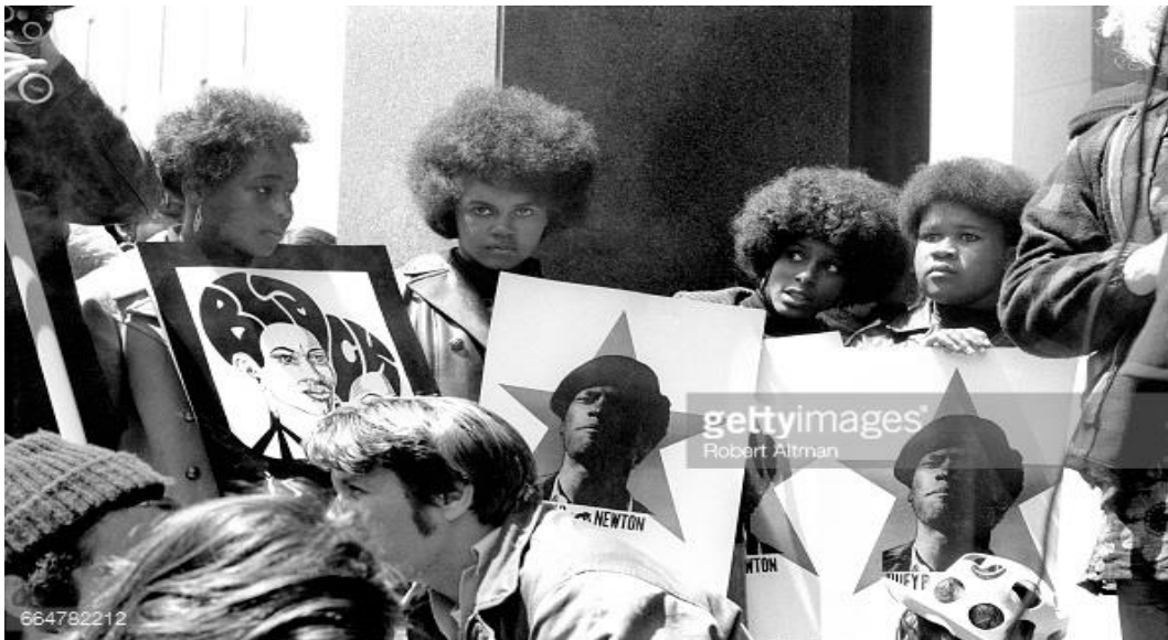
Figure 16. Photographie de militantes du Black Panther Party tenant des pancartes à l'effigie de Huey P. Newton lors d'un rassemblement, le 1 mai 1969, San Francisco, Californie, Consulté le 25 février 2017.