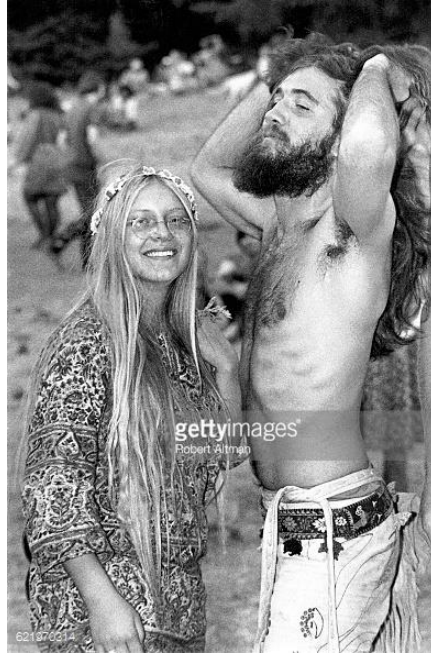
Figure 5. Photographie d'un couple hippie lors d'un évènement à Mount Tamalpais, Août 1968, San Francisco, Californie