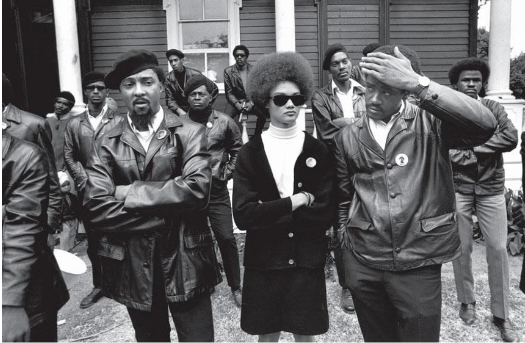
Figure 15. Photographie de la militante Kathleen Cleaver accompagnée à sa droite de Bobby Seale, cofondateur du Black Panther party, lors d'un rassemblement organisé pour la libération de Huey P. Newton à Oakland, Californie, été 1968, prise par Howard Bingham, dans "Life with the Black Panthers", Sean O'Hagan, The Guardian , 25 octobre 2009, www.theguardian.com/artanddesign/2009/oct/25/black-panthers-photographs-howard-bingham . Consulté le 20 mai 2017.