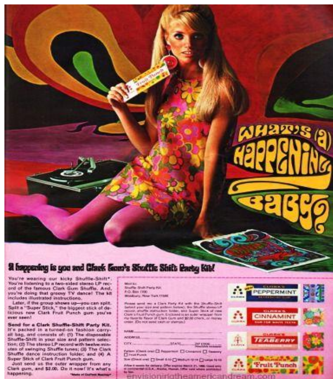
Figure 21. Publicité “What’s (a) Happening Baby?” pour la marque de chewing-gum Clark , 1967, http://www.retroarama.com/2013/04/mad-men-gets-its-groove-on.html . Consulté le 18 mars 2017.