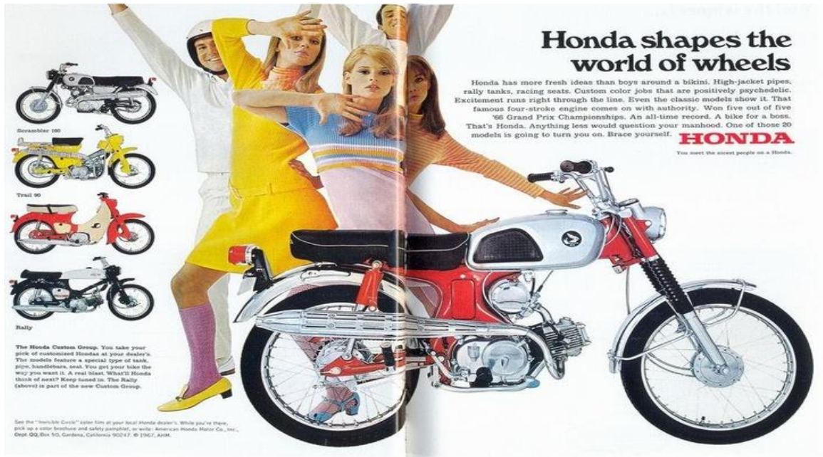
Figure 20. Publicité pour le constructeur de moto Honda , dans Life , 12 mai 1967, pp. 88-89, New York, Times Inc., Google Books, https://books.google.fr/books?id=K1YEAAAAMBAJ&printsec=frontcover&hl=fr&source=gbs_ge_summary_r&cad=0#v=twopage&q&f=false . Consulté le 15 mai 2017.