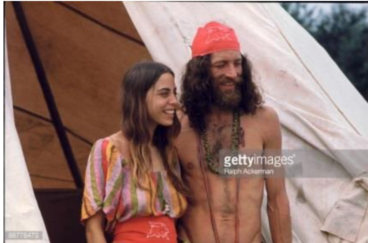
Figure 7. Photographie d'un couple de festivaliers hippies au festival de musique de Woodstock, Bethel, New York, 1 Août 1969, par Ralph Ackerman, Getty Images, collection Hulton Archive, Editorial n°88778473, www.gettyimages.fr/license/88778473 . Consulté le 27 février 2017.