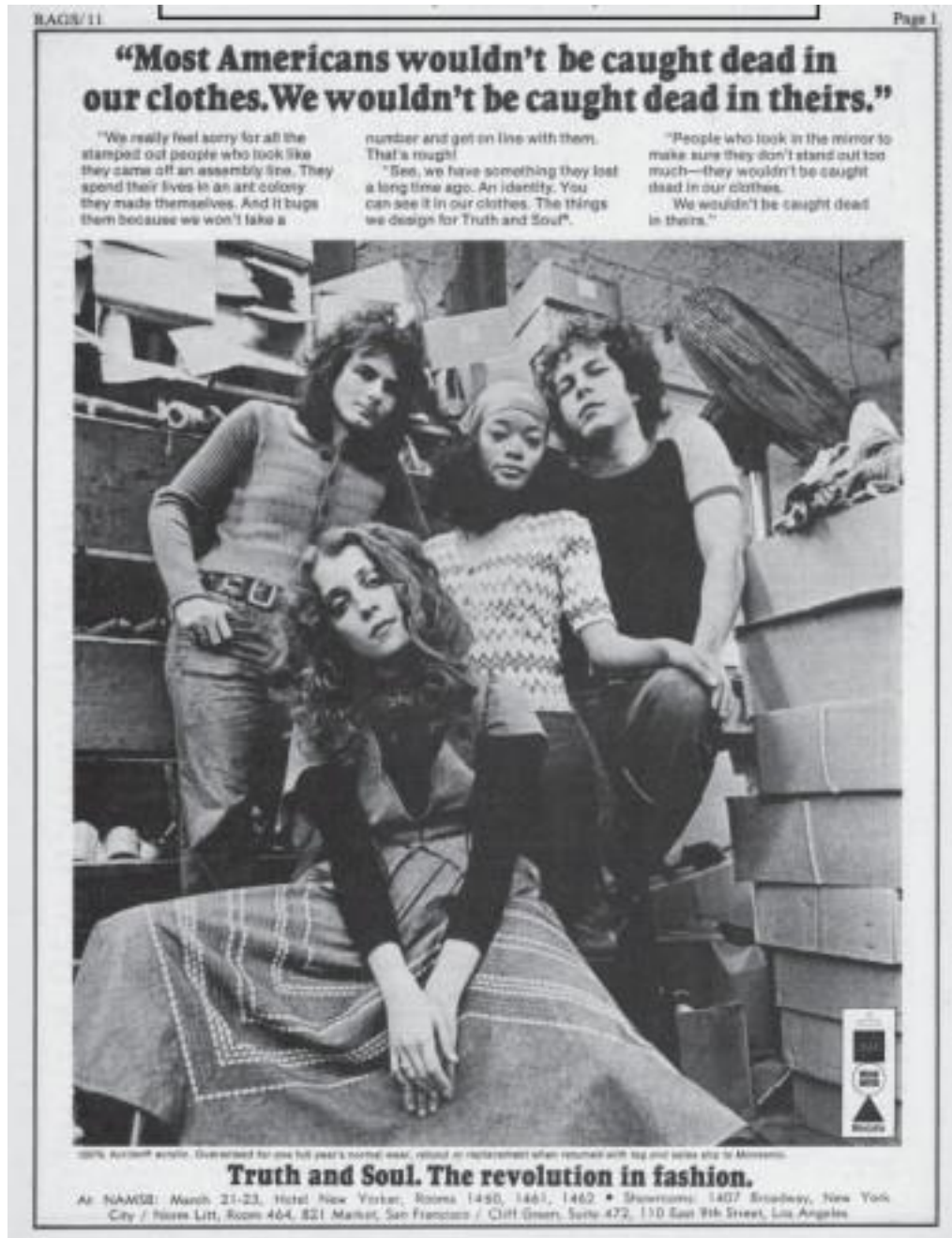
Figure 23. Publicité pour la marque de vêtements Truth and Soul , dans Rags magazine , San Francisco, Californie, Avril 1971, p. 1, Rags Lives, http://ragslives.blogspot.com/2007/01/april-1971-truth-and-soul-ads.html . Consulté le 15 mai 2018.