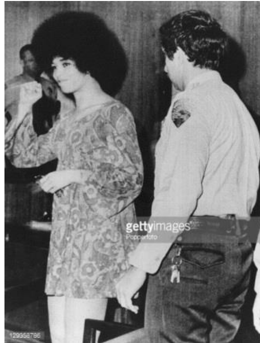
Figure 17. Photographie de l'activiste Angela Davis lors de son procès pour meurtre, San Rafael, Californie, 23 décembre 1970, Consulté le 20 mai 2017.