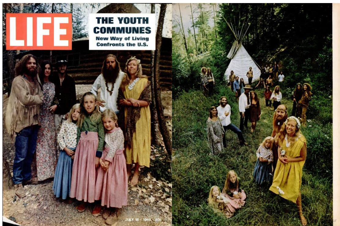
Figure 8 et 9. Photographie d'une communauté hippie prise pour la couverture du numéro du magazine Life parut le 18 juillet 1969, ainsi que pour un article intitulé "The Commune Comes to America" par John Stickney, photographie de John Olson, pp. 16B-23, New York, Times Inc. Print, Google Books, https://books.google.fr/books?id=K08EAAAAMBAJ&printsec=frontcover&hl=fr&source=gbs_ge_summary_r&cad=0#v=onepage&q&f=false . Consulté 8 février 2017.