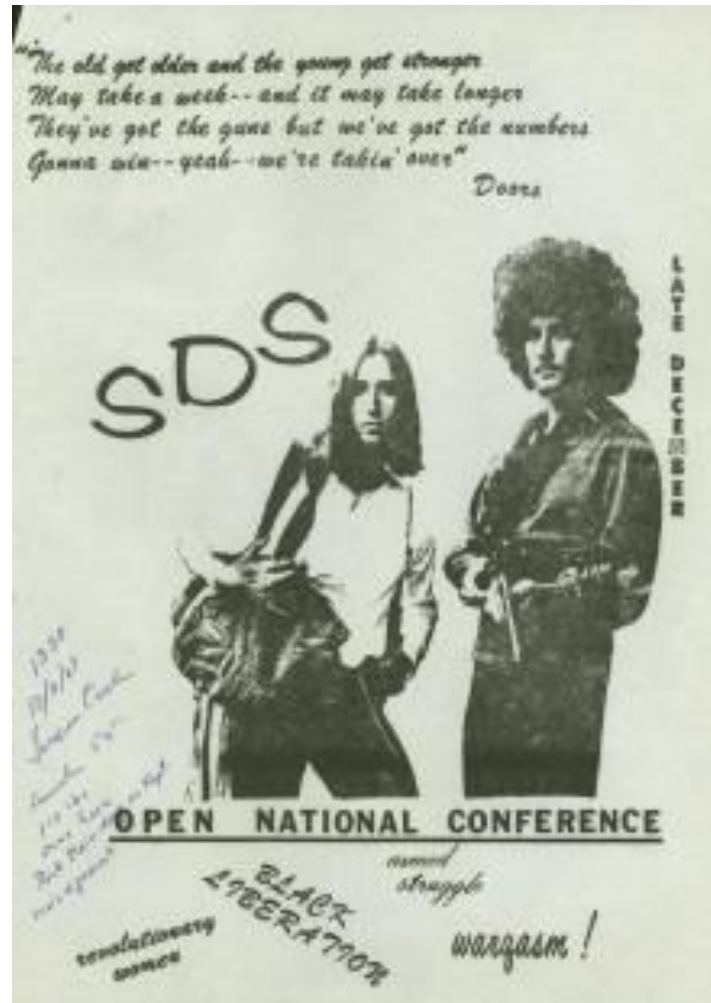
Figure 1. Poster annonçant une conférence nationale de la SDS, 4 décembre 1969, auteur inconnu, Students for a Democratic Society website, http://studentantiwar.blogs.brynmawr.edu/buy-support-sds/ . Consulté le 25 avril 2018.