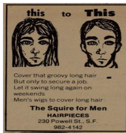
Figure 11. Publicité pour postiches pour hommes afin de dissimuler leurs cheveux longs et pouvoir trouver un emploi plus facilement, dans Berkeley Tribe , 8 mai 1970, p. 20, https://voices.revealdigital.com/cgi-bin/independentvoices?a=d&d=BFBJFGJ19700508.1.20&srpos=4&e=-05-1970-08-05-1970--en-20--1--txt-txIN-men%27s+wigs-----1# . Consulté le 10 février 2018.