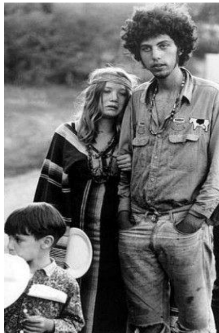
Figure 6. Photographie d'un couple hippie à San Francisco, Californie, Steve Shapiro, NY Times, A.G. Sulzberger, New York. Consulté le 20 mai 2017.