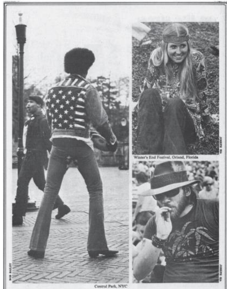
Figure 2. Photographies de membres de la contre-culture prises dans les rues de New York (1) et d'Orlando (2 et 3) pour "On the Streets", Rags , San Francisco, Californie, N°1, 1 juin 1970, p. 11, archives postées sur le blog Rags Lives, http://ragslives.blogspot.com/2006/11/june-1970-on-street.html . Consulté le 15 mars 2018.