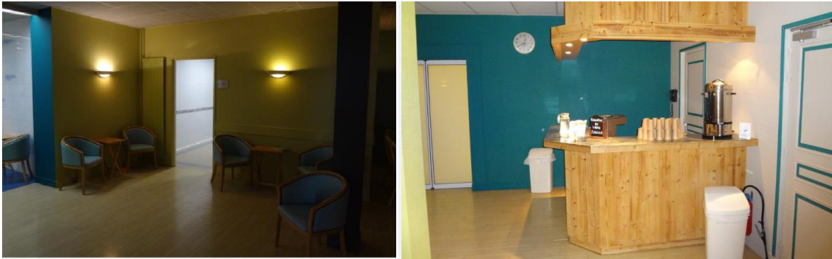
Photographies n°13 et n°14 : la tisanerie du deuxième étage

spa, à la salle boue des mains et brumisateur et enfin à l'espace piscine du spa thermal. Cette tisanerie propose des couleurs une nouvelle fois verte et marron et un sol en parquet flottant sur lequel sont disposés de nombreux sièges permettant de créer un véritable lieu de rendez-vous pour les clients. Ce lieu devient même le passage important de la matinée où l'on vient se reposer en buvant une boisson chaude et en discutant de tout et de rien avec les autres curistes.