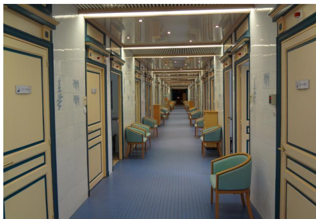
Photographie n°17 : le couloir du deuxième étage