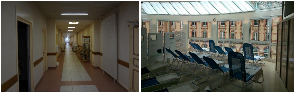
Photographies n°5 et n°6 : le couloir du deuxième étage et la salle de repos

Le deuxième étage propose néanmoins un autre ressenti que pour les deux premiers. Les couleurs beige et marron présentes aux murs et au sol, ainsi que les sièges en osier qui remplacent les chaises en plastique du rez-de-chaussée, procurent un aspect légèrement plus chaleureux. Cet étage donne également accès à la salle de repos, qui est l'atout détente et bien-être de cette partie thermes. La vue sur B'o Résidences et sur la forêt ainsi que le calme régnant permettent aux curistes de jouir au mieux du soin informel mais non moins important de la cure que constitue le repos.