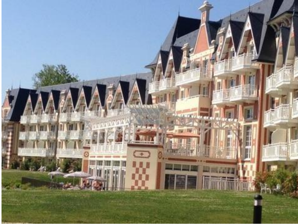
Le B'o Cottage