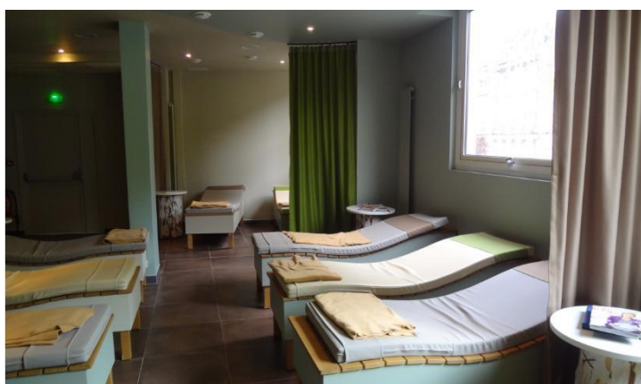
Photographie n°10 : la salle de repos du premier étage

Le curiste sortant des escaliers ou de l'ascenseur face à la tisanerie observe sur sa droite la salle de repos du B'o spa, et sur sa gauche l'espace bien-être et relaxation. La salle de repos du B'o spa offre une ambiance bien différente de celle du B'o thermes. En effet, cette pièce est scindée en deux parties par un épais rideau qui, d'un côté, permet aux curistes de s'étendre et de se divertir (en lisant par exemple), de l'autre, lui offre une atmosphère tamisée par des néons violets, couleur de la relaxation en luminothérapie, avec des petits lits légèrement incurvés fort confortables. On est ici bien loin des simples « chaises longues » de la salle de repos du côté thermes.