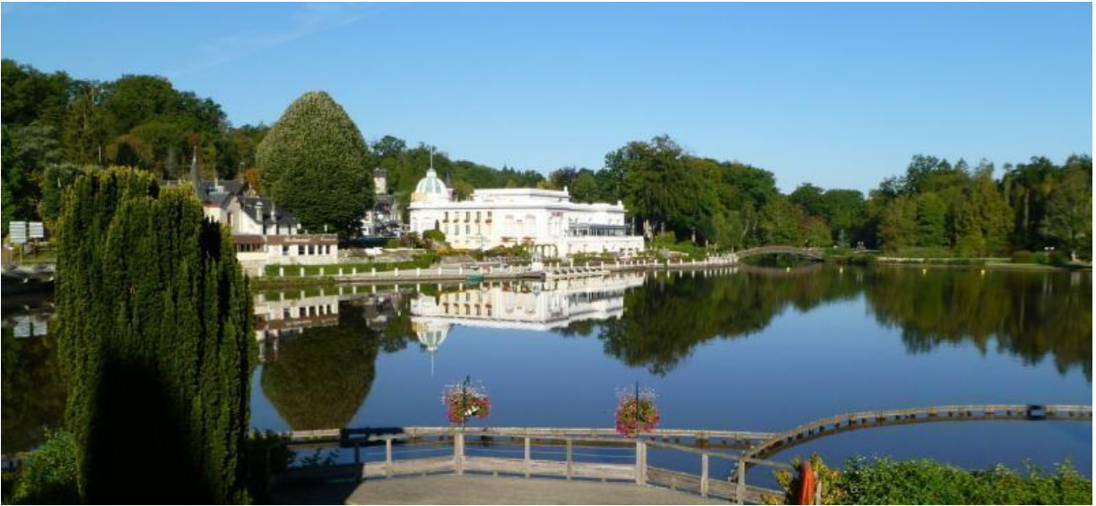
Le lac et le Casino de Bagnoles de l'Orne