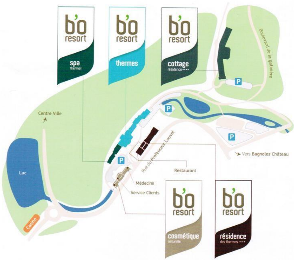
Plan de b'o resort