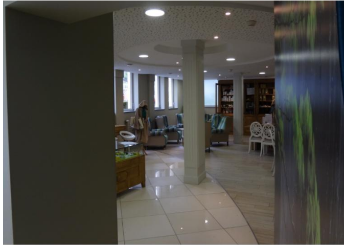
Photographie n°7 : l'accueil du B'O Spa Thermal