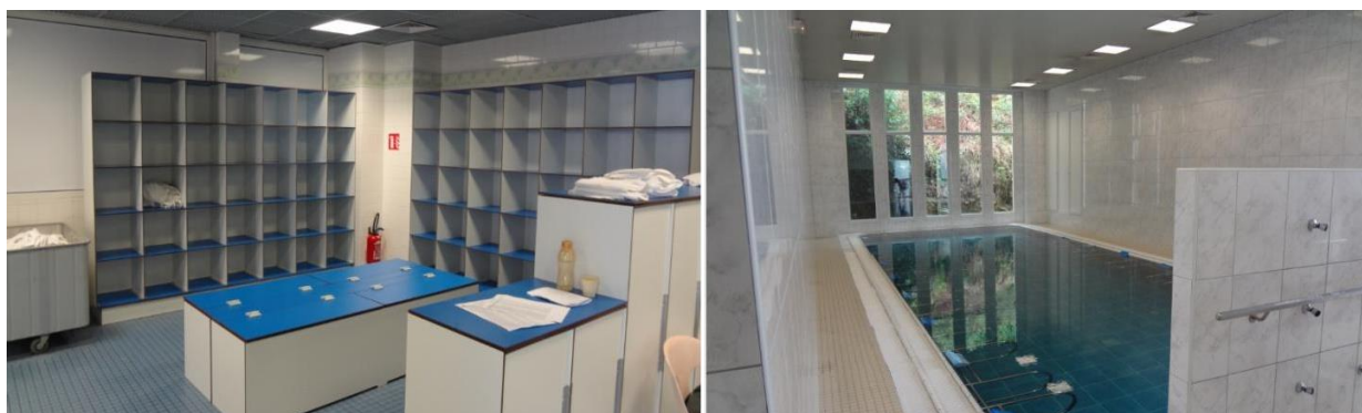
Photographies n°3 et n°4 : les casiers et la piscine du deuxième étage

Le dernier étage, pour sa part, est organisé légèrement différemment. En effet, l'escalier et l'ascenseur du centre deviennent le « bout du couloir », où une porte coulissante permet le seul accès au côté spa thermal par l'intérieur de l'établissement. Tout de suite en haut des escaliers se trouvent un bureau et un point fontaine à eau, donnant vue sur l'espace piscine et couloir de marche, largement plus important qu'au rez-de-chaussée. Un effort est fait dans l'espace piscine pour mettre le curiste à l'aise. Malgré, une fois encore, l'ambiance très « piscine municipale » procurée par les casiers, les fenêtres donnant sur la falaise et la forêt permettent au curiste de se laisser aller à une évasion le temps de sa séance.