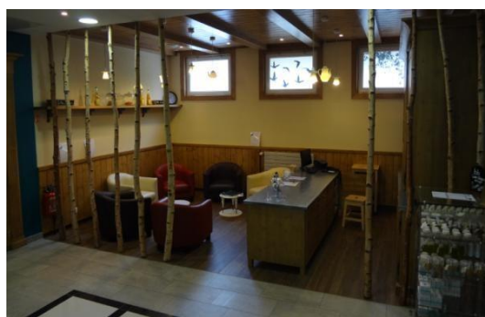
Photographies n°8 et n°9 : escalier et tisanerie du premier étage

Le curiste sortant des escaliers ou de l'ascenseur face à la tisanerie observe sur sa droite la salle de repos du B'o spa, et sur sa gauche l'espace bien-être et relaxation. La salle de repos du B'o spa offre une ambiance bien différente de celle du B'o thermes. En effet, cette pièce est scindée en deux parties par un épais rideau qui, d'un côté, permet aux curistes de s'étendre et de se divertir (en lisant par exemple), de l'autre, lui offre une atmosphère tamisée par des néons violets, couleur de la relaxation en luminothérapie, avec des petits lits légèrement incurvés fort confortables. On est ici bien loin des simples « chaises longues » de la salle de repos du côté thermes.