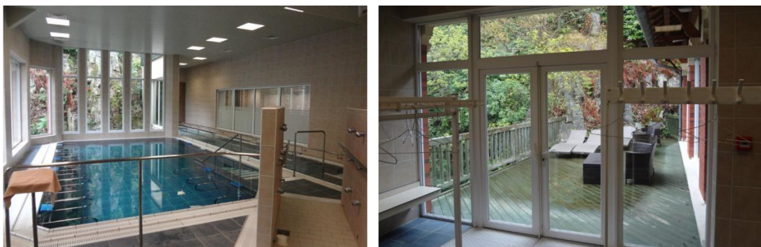
Photographies n°15 et n°16 : la piscine du Spa (deuxième étage)

L'espace piscine du spa, ne ressemble en rien aux deux autres piscines de l'établissement. De nombreuses fenêtres permettent au curiste de profiter de la forêt tout en réalisant ses exercices. Une petite terrasse en bois, sur laquelle se trouvent de nombreux sièges en osier, est même accessible par une porte fenêtre.