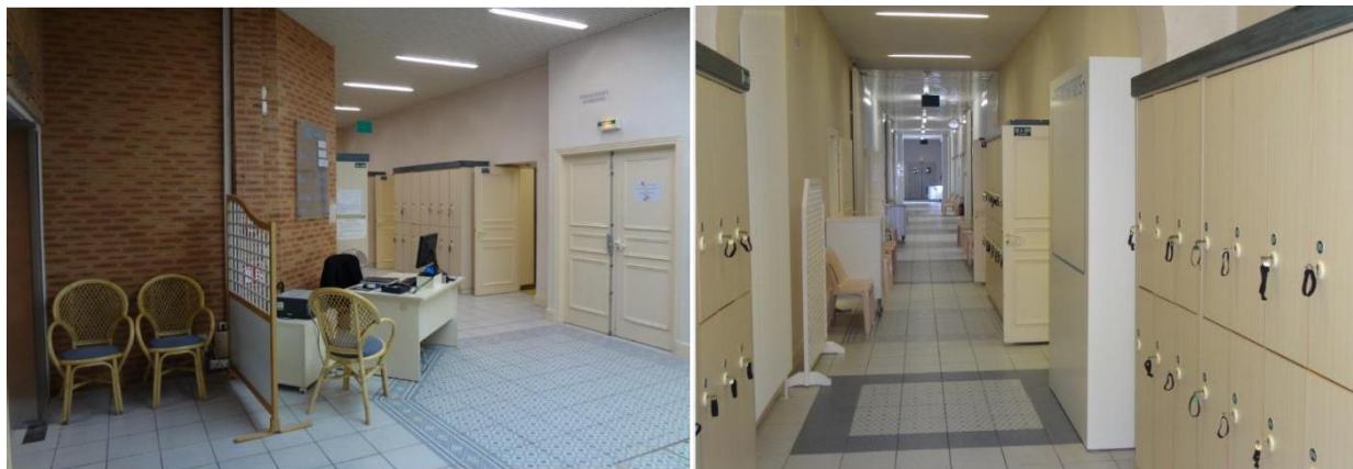
Photographies n°1 et 2 : Couloir du rez-de-chaussée

La couleur grise des murs s'étendant des vestiaires du personnel jusqu'à la piscine d'abord, puis la couleur jaune-beige réservée au reste du couloir, couplée au carrelage gris et à la grande hauteur sous plafond, loin de procurer une ambiance chaleureuse et protectrice, rappellent largement l'univers médical.