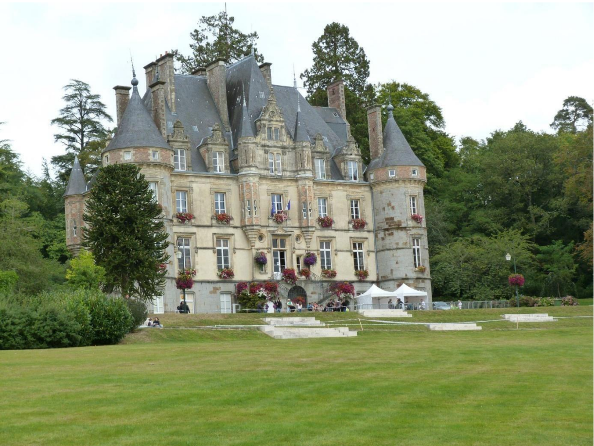
Le Château, hôtel de ville de Bagnoles de l'Orne