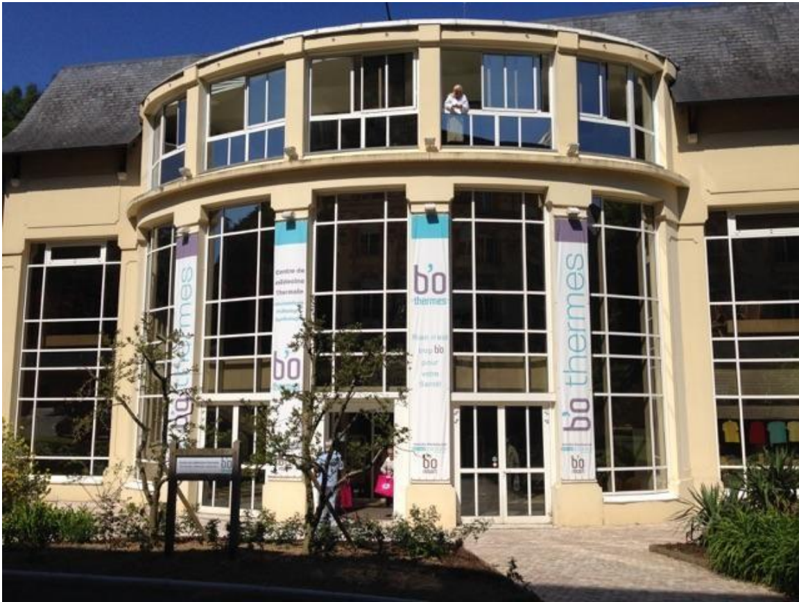
Devantures du B'o Thermes (ci-dessus) et du B'o spa thermal (ci-dessous)