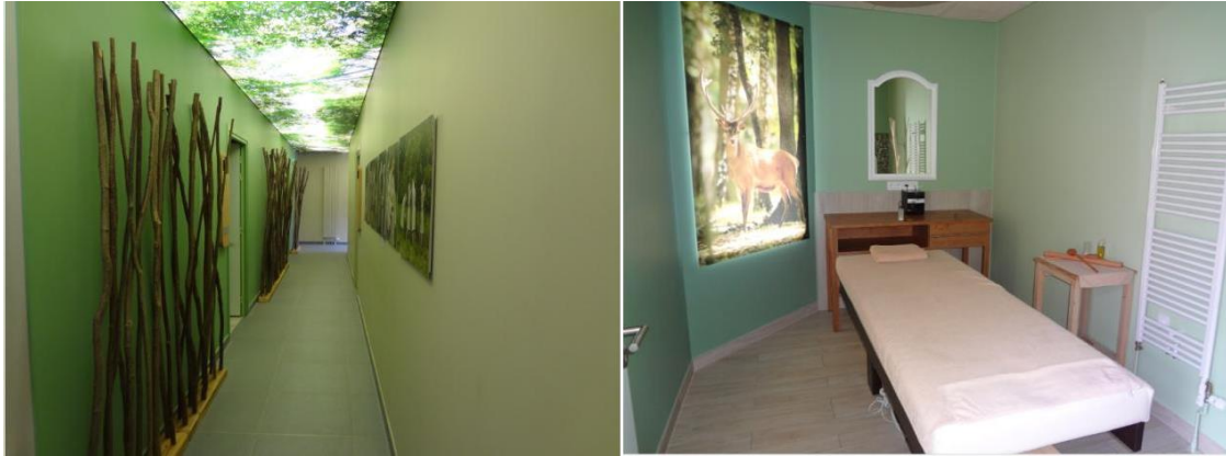
Photographies n°11 et n°12 : le premier étage relaxation (couloir et salle de massage

proximité entre le « client » et les professionnels de la structure. Dans l'optique de réaliser un spa à l'univers « bocage normand – forêt bagnolaise », l'ensemble des soins de cet étage est réalisé à base de pommes à cidre ainsi que d'eaux thermales.