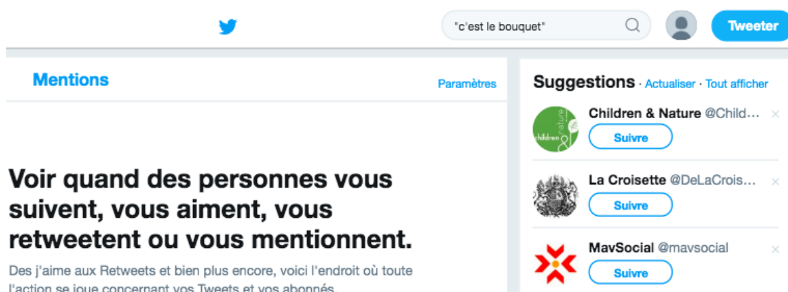
Figure 3. Création de la recherche sur Twitter.

Pour trouver les tweets qui comportaient les ALS analysés et les expressions formant le paradigme, nous les avons écrits entre guillemets (l'un après l'autre) dans le moteur de recherche (Voir Figure 3.). Après avoir lancé la recherche, nous avons obtenu un grand nombre d'occurrences à partir desquelles nous avons manuellement repéré des exemples bien illustrant la fonction expressive et des modifications de nos phraséologismes pragmatiques et des autres expressions.