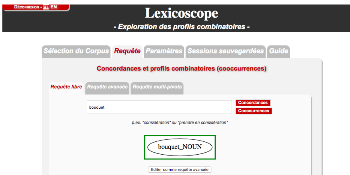
Figure 1. Création de la requête libre sur Lexicoscope.

c'était le corpus GEN : Corpus général de phraseorom de la langue française, contenant 444 textes et 34 334 554 mots. Puis, nous sommes passées à la requête libre où nous avons saisi (l'un après l'autre) le nom prédicatif faisant partie de chacune des expressions pour chercher les concordances. Ce type de requête a ensuite demandé un tri manuel des résultats enregistrés en format Excel. Ce tri nous a permis de bien étudier toutes les occurrences et de trouver des variantes, équivalents et modifications possibles 15 .