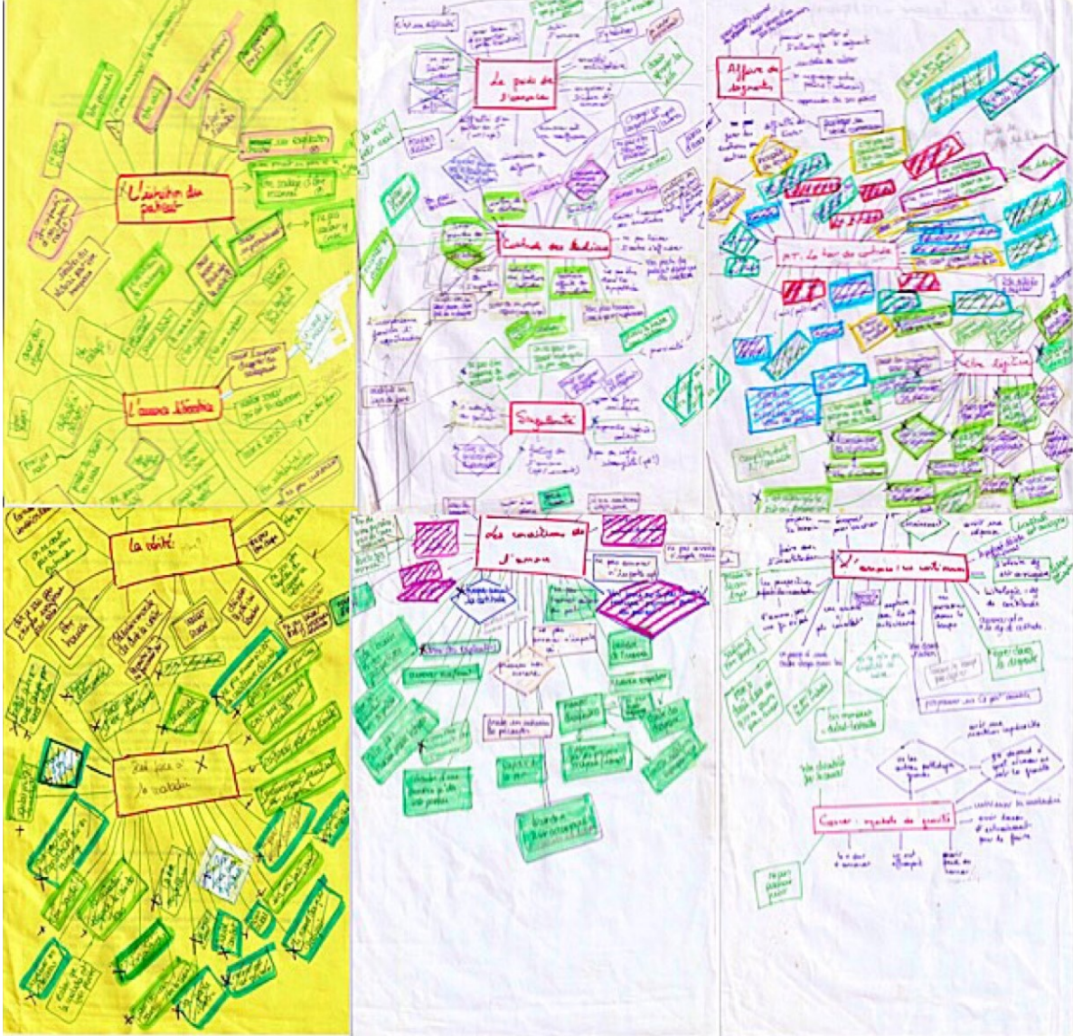
Figure 1 : Codage axial et sélectif, mise en relation des catégories