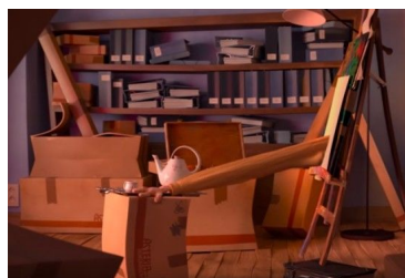
Fig.5, La cour , 2016[00:06:16]