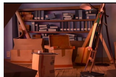
Fig. 6, La cour , 2016 [00:06:19]

Cette posture est celle qui a été la plus difficile d'accès aux élèves : comme énoncé, le travail sur le hors-champ s'appuie sur ce que nous avons précédemment construit comme ressort imaginaire chez