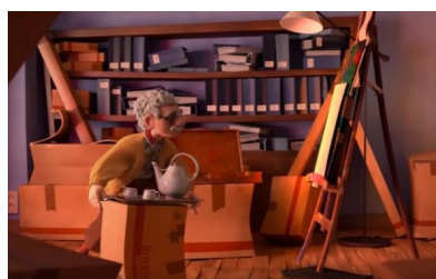
Fig. 4, La cour , 2016 [00:06:11]

Enfin, la troisième manière de venir interroger l'implicite à l'aide du hors-champ s'est inscrit dans une posture plus imaginative. Elle vient s'appuyer sur la chute du court-métrage, où nous assistons à la disparition des personnages à l'intérieur d'un canevas vierge de peinture. Il s'agit alors d'interprétation libre, car l'action fantastique permet de se détacher de la nécessité précédente de proposer un argument plausible.