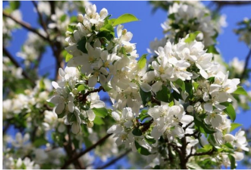
Figure 50 Malus sylvestris (232)

Les bourgeons de pommier donnent une sensation de fraîcheur en cas d'excès de chaleur, en exerçant une activité anti-inflammatoire notamment sur les stases de sang ou les bouffées de chaleur de la ménopause. Ils agissent sur le cerveau mais également sur la tonicité sexuelle aussi bien sur le plan physique que psychique. (21)