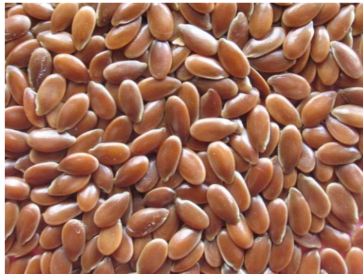
Figure 45 Linum usitatissimum (213)

Le lin est cultivé au Moyen-Orient depuis des siècles. Ses graines et ses fibres ont de nombreux usages aussi bien industriels que médicaux. Outre sa richesse en mucilage, la graine de lin contient également une huile riche en acides gras polyinsaturés, des protéines, des hétérosides cyanogènes et des glucosides de lignanes (sécoisolaricirésinol, matairésinol). En plus de son activité laxative, la graine de lin présente des propriétés estrogéniques en lien avec la dégradation des glucosides de lignanes en entérodiol et entérolactone qui sont des phytoestrogènes. (46,68)