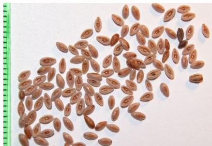
Figure 28 Plantago ovata (145)

Le psyllium ( Plantago indica ) et l'ispaghul ( Plantago ovata ) sont 2 espèces issues de la même famille botanique qui servent de laxatif depuis des siècles en Europe, en Afrique du Nord et en Asie. Leurs graines sont très riches en mucilages ayant la propriété de pouvoir absorber de grandes quantités d'eau. Elles appartiennent à la catégorie des laxatifs de lest car les mucilages permettent d'augmenter le volume du