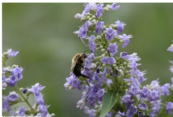
Figure 3 Vitex agnus-castus (35)