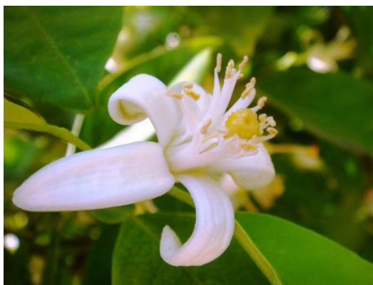
Figure 47 Citrus aurantium (227)

L'oranger amer permet d'obtenir 3 HE différentes en fonction de l'organe distillé. La fleur d'oranger, une fois distillée, donne l'HE de néroli connue pour ses propriétés anxiolytique, sédative et antidépressive. Ces propriétés étaient déjà connues aux XVIII ème et XIX ème siècles puisque l'eau de fleur d'oranger était utilisée comme calmant. Les propriétés sédatives s'expliquent par la présence d'esters monoterpéniques comme l'acétate de linalyle et d'alcools monoterpéniques tels que le linalol. (16,20,50)