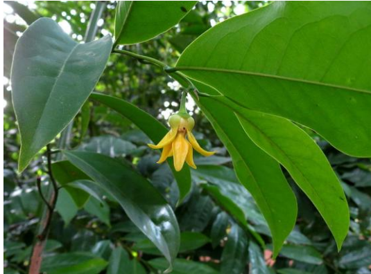
Figure 48 Cananga odorata (229)

L'HE d'ylang-ylang est principalement utilisée pour ses propriétés calmantes et relaxantes. Elle combat la fatigue qu'elle soit physique, intellectuelle ou sexuelle, d'où une utilisation traditionnelle de cette plante pour ses vertus aphrodisiaques. L'HE contient des alcools monoterpéniques comme le linalol, des phénols-méthyl-ethers comme le p -crésol et des esters comme l'acétate de géranyle ou de benzyle. (13,230)