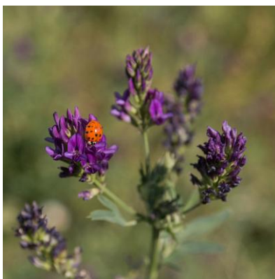
Figure 44 Medicago sativa (209)

Surtout utilisée pour nourrir les animaux, la luzerne (aussi appelée alfalfa) est particulièrement riche en protéines. Elle contient également des saponosides triterpéniques ainsi que des isoflavones (et notamment de la daidzéine, génistéine, glycytéine) et du coumestrol. Ces derniers composés lui confèrent des propriétés estrogéniques. Elle peut donc être utilisée dans les troubles de la ménopause. (46,68)