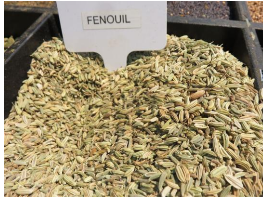
Figure 37 Foeniculum vulgare (183)

Bien que les fruits de fenouil soient utilisés traditionnellement pour traiter les flatulences, ils sont aussi connus pour stimuler la lactation. Ils contiennent des lipides, des acides phénols simples, des flavonoïdes ainsi qu'une HE composée en grande partie d'anéthole qui est considéré comme un phytoestrogène à activité anti-dopaminergique conduisant à la libération de prolactine. (46,68,184)