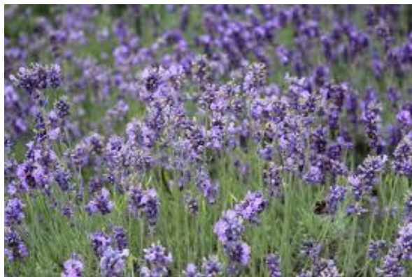
Figure 11 Lavandula officinalis (70)