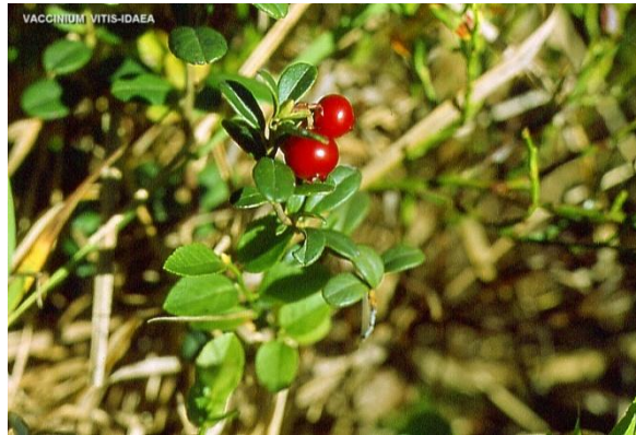
Figure 49 Vaccinium vitis-idaea (231)

Les bourgeons d'airelle exercent leur activité principale sur la sphère uro-génitale. Ils sont recommandés dans la ménopause comme antispasmodique mais également pour lutter contre les bouffées de chaleur. (21)