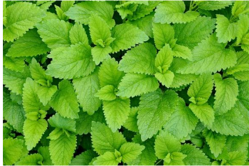
Figure 30 Melissa officinalis (158)

Les feuilles de mélisse sont riches en acides phénols comme l'acide rosmarinique et contiennent également des flavonoïdes et une faible quantité d'HE riche en citrals. Elles sont utilisées depuis l'Antiquité pour leurs propriétés apaisantes sur le système nerveux et le système digestif. La mélisse est en effet un relaxant notamment en cas d'anxiété surtout si celle-ci provoque des troubles digestifs tels qu'une acidité gastrique, des indigestions, des ballonnements, des coliques... (46,64,68)