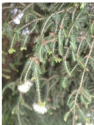
Figure 21 Melaleuca alternifolia (112)

L'HE d'arbre à thé (« tea tree », Melaleuca alternifolia , feuilles) est l'HE anti-acné de référence car c'est une HE anti-infectieuse majeure et antibactérienne à large spectre en lien avec la présence d'alcools monoterpéniques comme le terpinène-1-ol-4 et de carbures monoterpéniques comme le \gamma -terpinène. Elle est également anti-inflammatoire et cicatrisante, principalement au niveau cutané. (20,113,114)