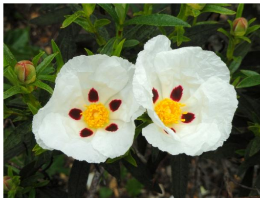
Figure 13 Cistus ladaniferus (78)

Par ses propriétés astringentes, cicatrisantes, antiseptiques, l'HE de ciste ladanifère arrête les saignements, facilite la cicatrisation de plaies superficielles et évite la surinfection. Elle est donc indiquée dès qu'il y a un saignement anormal : épistaxis, règles abondantes, hémorroïdes qui saignent... Elle doit cette propriété anti-hémorragique à sa richesse en carbures monoterpéniques comme l' \alpha -pinène. Elle contient également des esters monoterpéniques (acétate de bornyle), des cétones monoterpéniques (pinocarvone) et des alcools sesquiterpéniques. (12,20,50,79)