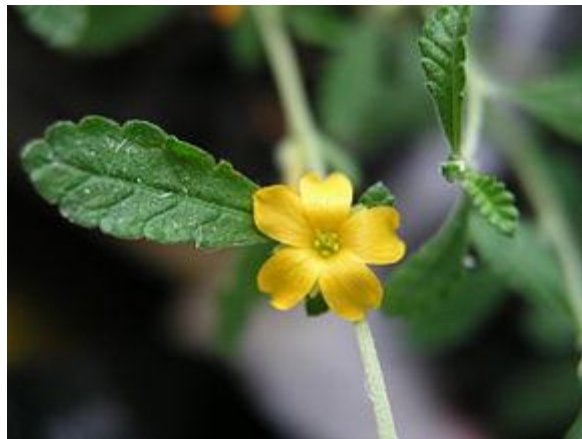
Figure 46 Turnera diffusa (221)

Le damiana est une plante connue pour ses propriétés aphrodisiaques. Les Indigènes du Mexique en tiraient une boisson aphrodisiaque et lui attribuaient également des vertus médicinales pour le traitement des troubles menstruels, particulièrement chez les jeunes filles. (46,222)