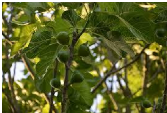
Figure 18 Ficus carica (103)