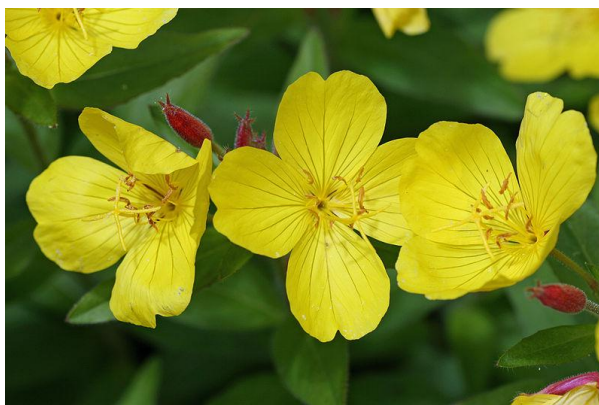
Figure 4 Oenothera biennis (42)

L'onagre est une plante cultivée à grande échelle pour récolter des graines qui fournissent une huile très riche en acides gras essentiels très utiles pour lutter contre les troubles féminins du syndrome prémenstruel et de la ménopause. (37)