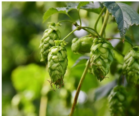
Figure 40 Humulus lupulus (192)

Les inflorescences femelles du houblon, également appelées strobiles, contiennent des principes amers comme l'humulone et la lupulone, une HE riche en carbures sesquiterpéniques comme l'humulène, des flavonoïdes dérivés du quercétol ou des chalcones (xanthohumol) pouvant se transformer en isoflavanones. Ces dernières sont responsables d'une activité estrogénique par agonisme avec les récepteurs \alpha de l'estradiol et seraient capables de stimuler la production de lait maternel. (37,46,68)