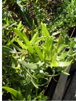
Figure 6 Artemisia dracunculus (49)

L'HE d'estragon possède des propriétés multiples mais surtout une remarquable activité antispasmodique, neuromusculaire et utérine. Elle est également anti-inflammatoire et peut également avoir une action hormonale. Elle est principalement indiquée pour les maux de ventre quelle qu'en soit la cause ainsi que pour les douleurs gynécologiques, douleurs de règles, douleurs prémenstruelles, dysménorrhées et les congestions ou spasmes du bas-ventre. Ses indications s'expliquent par sa composition riche en méthylchavicol appelé plus communément estragole, qui est une substance connue pour ses effets spasmolytiques sur les fibres musculaires lisses notamment. (50,51)