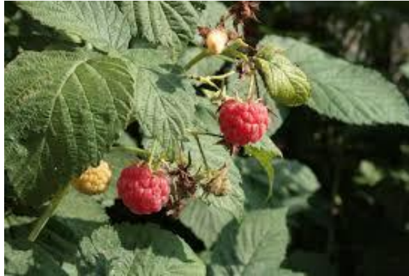
Figure 8 Rubus idaeus (55)

Les bourgeons de framboisier ( Rubus idaeus ) sont fréquemment employés en gemmothérapie pour leur activité au niveau du système hormonal féminin, notamment en cas de dysménorrhées, aménorrhées ou oligoménorrhées fonctionnelles. Le framboisier régule les déséquilibres neurovégétatifs (frigidité, trouble de la libido) et stimule la sécrétion d'estrogènes et de progestérone. Ainsi il agit efficacement sur les retards de règles, équilibre les dysendocrinies et est recommandé en période de pré-ménopause. Il possède également une action antispasmodique utérine, utile en cas de dysménorrhées. (21)