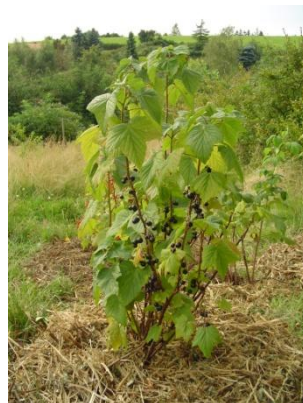
Figure 22 Ribes nigrum (119)