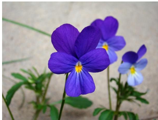
Figure 19 Viola tricolor (106)

La pensée sauvage est connue pour ses bienfaits depuis l'Antiquité. C'est une plante anti-inflammatoire de par la composition de ses fleurs, riches en acide salicylique et dérivés. Elles renferment également des mucilages, des flavonoïdes et des tanins. Ces tanins lui confèrent des propriétés astringentes lui permettant de rééquilibrer le pH des peaux grasses afin de limiter l'excès de sébum et la formation de comédons. Les flavonoïdes quant à eux stimulent les fonctions d'élimination de l'organisme et permettent donc de purifier la peau. (37,64,107)