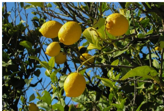
Figure 26 Citrus limon (137)