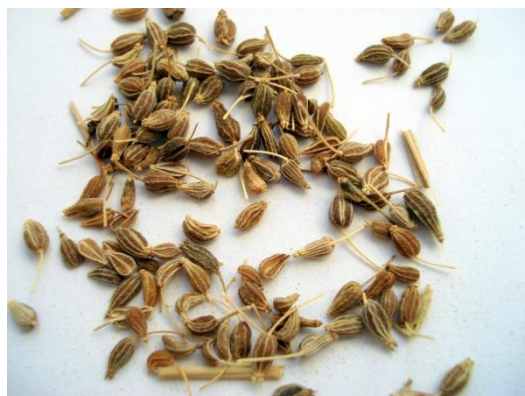
Figure 38 Pimpinella anisum (185)

En dehors de son usage culinaire, l'anis vert est utilisé en médecine traditionnelle pour soulager les douleurs abdominales, la toux mais également pour favoriser la montée de lait. Les fruits d'anis vert contiennent également de l'anéthole (46,68,186)