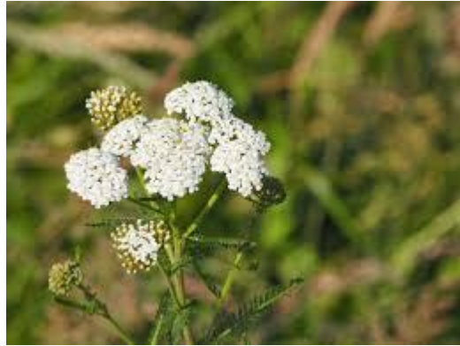
Figure 5 Achillea millefolium (45)

L'achillée millefeuille est une plante reconnue comme efficace depuis des milliers d'années. Les parties aériennes de l'achillée contiennent une HE riche en mono- et sesquiterpènes (azulène, cinéole, camphre...) ainsi que des flavonoïdes. L'achillée possède une action anti-inflammatoire, emménagogue et cholérétique. Elle joue également le rôle de régulateur sanguin. Les feuilles sont plutôt hémostatiques et cicatrisantes, alors que les fleurs sont davantage antispasmodiques. (46)