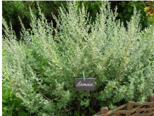
Figure 9 Artemisia vulgaris (62)

L'armoise est utilisée depuis l'Antiquité pour les problèmes de santé chez la femme. Ses sommités fleuries contiennent une HE de composition qualitativement et quantitativement variable selon le lieu de culture (en général camphre, linalol, cinéole). L'armoise est une plante emménagogue qui stimule le flux sanguin dans la région utéro-pelvienne. Elle présente également des propriétés antispasmodiques permettant de lutter contre les spasmes musculaires. L'armoise sert, entre autres, pour le traitement de l'aménorrhée et des dysménorrhées. Elle permet également de régulariser le cycle menstruel et de soulager les règles difficiles, douloureuses et tous les symptômes liés à la ménopause. (63,64)