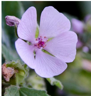
Figure 29 Althaea officinalis (155)

La guimauve est employée depuis longtemps pour ses vertus adoucissantes. Des écrits latins indiquent qu'elle était notamment utilisée pour soulager les inflammations et les ulcères gastriques. (37,156)