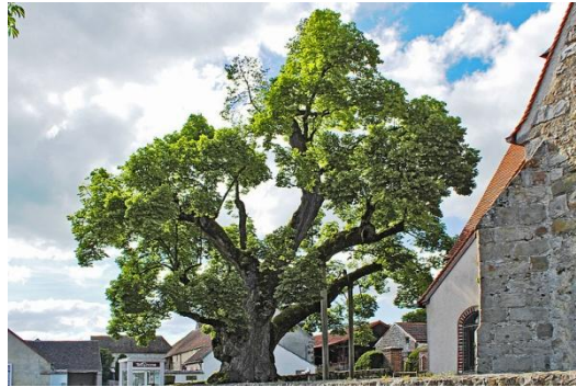
Figure 33 Tilia tomentosa (165)

Les bourgeons de tilleul sont connus pour leur action calmante et antispasmodique. Ils agissent également au niveau digestif en cas de syndromes inflammatoires chroniques comme les gastrites, les colites spasmodiques, les spasmes pyloriques et les dysphagies œsophagiennes. (21)