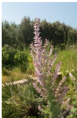
Figure 7 Salvia sclarea (53)

L'HE de sauge sclarée pourrait être appelée l'HE des femmes puisqu'elle est une HE incontournable de la ménopause et des règles tardives. Il est à noter que dans la mythologie, elle aidait notamment la femme à accoucher. (50)