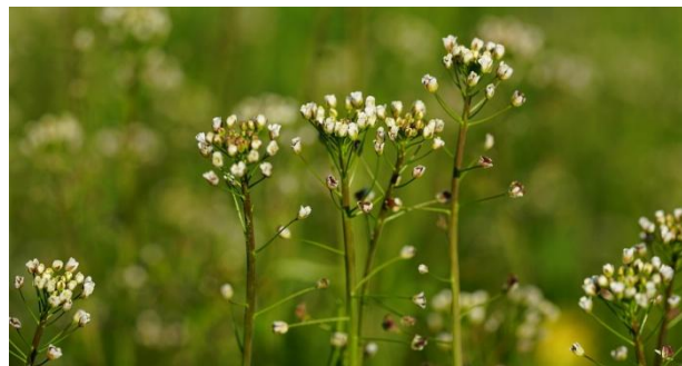
Figure 12 Capsella bursa-pastoris (75)