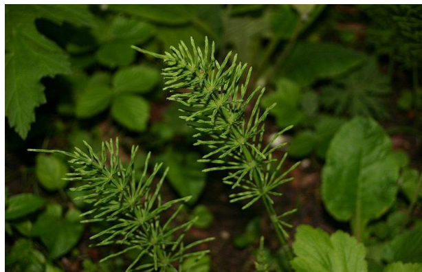
Figure 51 Equisetum arvense (235)

La prêle des champs est riche en éléments minéraux (environ 10%) composés de 2/3 d'acide silicique et de silicates dont 10% sont solubles et donc absorbables. Elle contient également des flavonoïdes et des dérivés de l'acide caféique. Cette plante présente principalement un effet diurétique en lien avec la présence de flavonoïdes. Cependant la prêle est également utilisée pour prévenir la perte osseuse ou aider à la guérison de fractures ou foulures. La silice intervient dans la structure de la trame osseuse et est responsable du maintien du calcium dans l'os. (21,68,211,236)