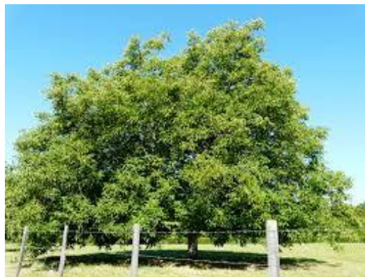
Figure 23 Juglans regia (121)

Les bourgeons de noyer sont considérés comme l'anti-infectieux de l'appareil cutané notamment dans les abcès, l'acné, l'herpès, l'impétigo et dans de nombreuses dermatoses chroniques comme le psoriasis ou des eczémas divers. (21,22,122)