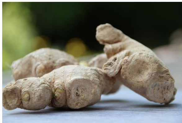
Figure 25 Zingiber officinale (133)

Très prisé en Asie depuis les temps anciens, le rhizome de gingembre ( Zingiber officinale ) est un condiment très répandu mais également un des remèdes naturels les plus utilisés au monde. Il peut soulager des problèmes très variés allant du mal de tête aux douleurs articulaires et même le mal des transports et les nausées matinales. (46)