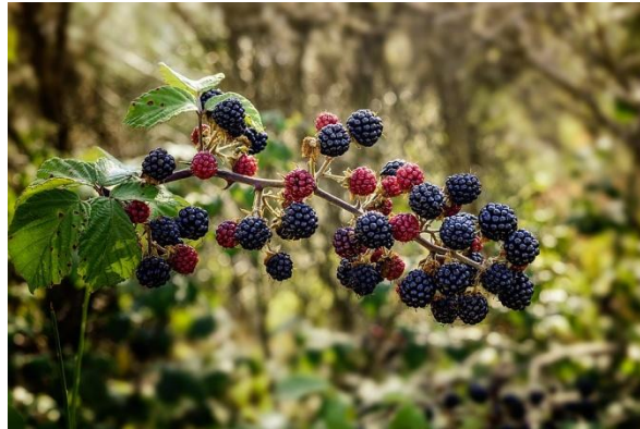
Figure 53 Rubus fruticosus (239)

Les bourgeons de ronce possèdent une activité sur les ostéoblastes et vont donc être intéressants pour les troubles du système ostéo-articulaire. Ils sont efficaces contre l'arthrose des sujets âgés, la perte osseuse et les rhumatismes chroniques dégénératifs. Ils vont consolider le tissu osseux et lutter contre l'ostéoporose.