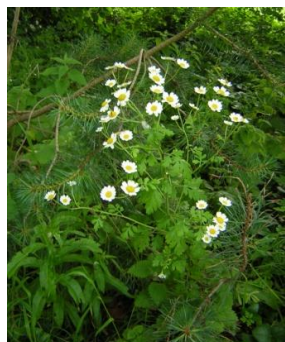
Figure 16 Tanacetum parthenium (94)