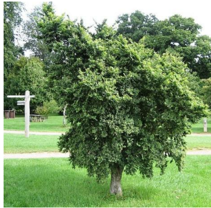
Figure 24 Ulmus minor (123)

Les bourgeons d'orme présentent un profil thérapeutique très proche de celui décrit pour l'écorce. L'orme est un excellent draineur de la peau et est recommandé dans diverses dermatoses inflammatoires telles que l'acné (en régulant la sécrétion des glandes sébacées), l'herpès, la couperose, les urticaires, les démangeaisons diverses. Il est efficace dans tout type de dermatose quelle que soit la partie du corps concernée. (21)