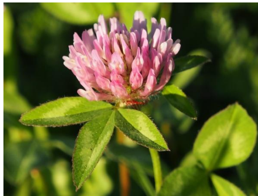
Figure 43 Trifolium pratense (206)

Les parties aériennes de trèfle rouge renferment plusieurs isoflavones dont la formononétine, la biochanine, la daidzéine et la génistéine. Grâce aux propriétés estrogéniques des isoflavones, cette plante peut soulager les troubles liés à la ménopause. (46,68)