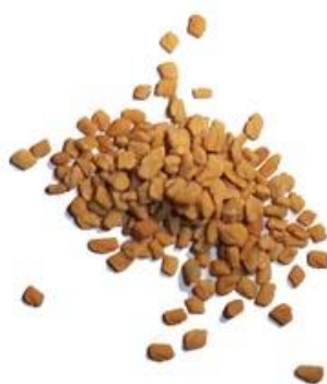
Figure 39 Trigonella foenum-graecum (188)

Les graines de fenugrec sont largement utilisées dans de nombreux pays pour stimuler la production de lait maternel. Bien que le mécanisme d'action n'ait pas encore été parfaitement élucidé, des théories suggèrent que ces graines stimulent la production de sueur, or le sein est une forme modifiée de glande sudoripare, ainsi elles pourraient être susceptibles de stimuler le sein et donc d'augmenter la