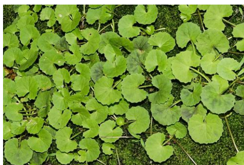
Figure 34 Centella asiatica (171)