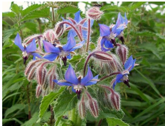
Figure 35 Borago officinalis (175)

Par son huile extraite des graines, la bourrache est une plante médicinale qui présente des propriétés intéressantes aussi bien par voie interne que par voie externe. Par sa richesse en acides gras polyinsaturés et notamment acide linoléique et acide gamma-linolénique, elle est indiquée dans les irrégularités du cycle féminin mais également dans les problèmes cutanés comme l'eczéma, le dessèchement la peau, l'apparition de rides ou de vergetures. Elle nourrit les cellules de la peau et les protège de la déshydratation, elle régénère et assouplit également l'épiderme. (20,37)