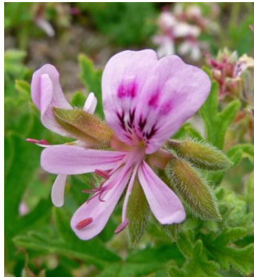
Figure 14 Pelargonium asperum (80)

L'HE de géranium rosat est un hémostatique puissant qui arrête les saignements et les hémorragies, notamment en cas de règles très abondantes ou de gencives qui saignent. Les alcools monoterpéniques (géraniol, citronnellol, linalol), les cétones monoterpéniques (isomenthone) et les aldéhydes monoterpéniques (géraniol) présents dans cette HE sont responsables de cette activité. (12,20,50,81)