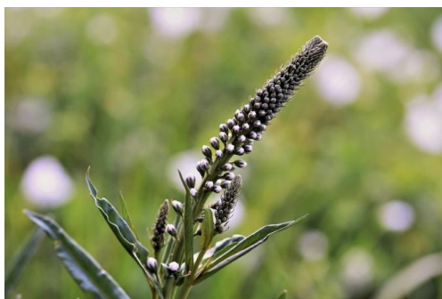
Figure 10 Actea racemosa (66)

L'actée à grappes est une plante réputée pour soulager les symptômes de la ménopause. Cependant, les Amérindiens qui étaient les premiers à faire un usage médical de cette plante l'utilisaient pour lutter contre les douleurs menstruelles, celles de l'accouchement mais également en gargarisme pour les maux de gorge, ainsi que pour les rhumatismes.