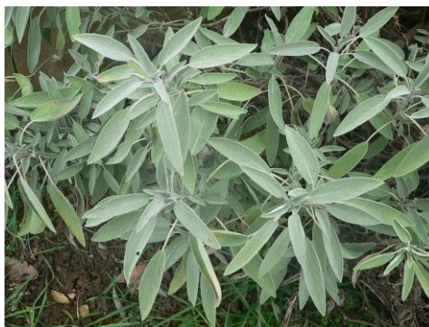
Figure 41 Salvia officinalis (194)