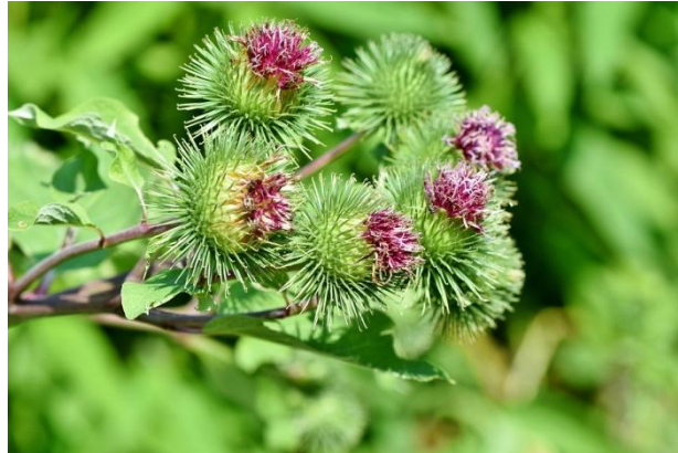
Figure 20 Arctium lappa (109)

La bardane ( Arctium lappa ) est réputée comme plante de la peau depuis de nombreuses années. C'est une plante purifiante permettant d'épurer le corps en cas de problèmes de peau chroniques. La racine de bardane contient principalement de l'inuline, des acides phénols (comme l'acide caféique et l'acide chlorogénique) et des composés polyinsaturés de type polyènes et polyines. Ces derniers confèrent à la bardane des propriétés antimicrobiennes, antibactériennes, antifongiques et antiseptiques associées à des propriétés anti-inflammatoires. (37,46,64,68)