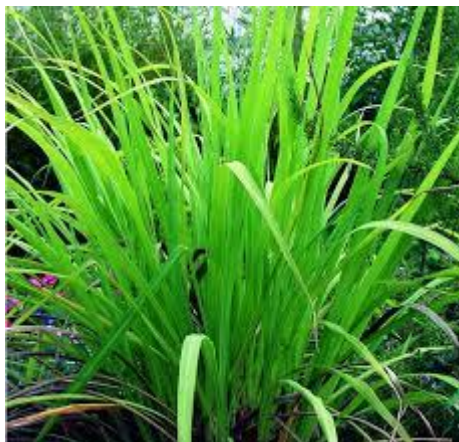
Figure 15 Cymbopogon martinii (89)

L'HE de palmarosa ( Cymbopogon martinii , herbe) est riche en géraniol et surtout connue pour ses propriétés antibactériennes, antivirales et antimycosiques puissantes mais elle est également drainante lymphatique, décongestionnante, anti-