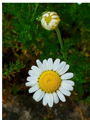
Figure 32 Chamaemelum nobile (164)

La camomille romaine est l'une des plantes les plus appréciées en cosmétologie, phytothérapie et aromathérapie. Son HE, riche en esters monoterpéniques, possède de multiples vertus dont la plus connue est la relaxation. Elle est en effet sédatrice, calmante, relaxante, antalgique. La présence de carvone lui confère également une activité spasmolytique. (13,20,50)