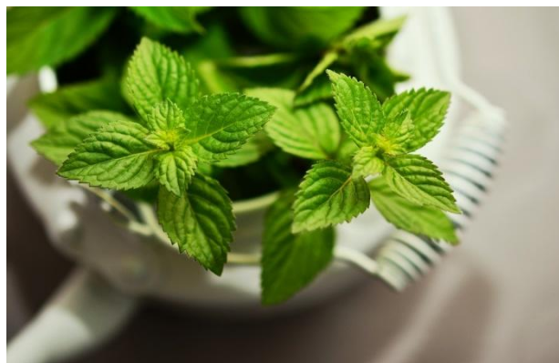
Figure 17 Mentha x piperita (100)