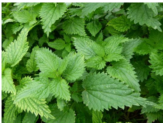
Figure 52 Urtica dioica (238)

L'ortie est une plante très envahissante et cosmopolite qui présente de nombreuses vertus thérapeutiques. Les feuilles d'ortie contiennent des flavonoïdes, des dérivés de l'acide caféique ainsi qu'une forte concentration d'éléments minéraux dont du calcium, du potassium et des silicates partiellement solubles (1-4%). Elle est conseillée pour lutter contre les rhumatismes, la fatigue, la déminéralisation et l'ostéoporose, notamment par sa richesse en silice et en calcium. (37,46,64,68)