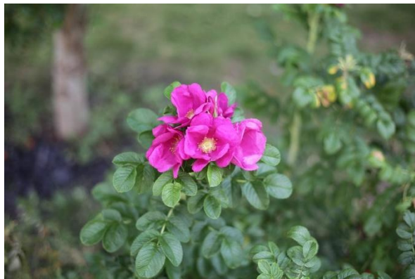
Figure 36 Rosa rubiginosa (176)

La rose musquée produit des fruits riches en petites graines dont on peut extraire une huile utilisée depuis des siècles dans les Andes et au Chili pour atténuer les cicatrices. L'huile de rose musquée contient environ 80% d'acides gras polyinsaturés (acides linoléique et \alpha -linoléique) ainsi que des vitamines A et E, ce qui lui confère des propriétés régénératrices cellulaires. (20,37)