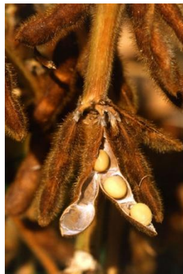
Figure 42 Glycine max (205)

Le soja est un aliment très répandu et consommé en Asie. La graine de soja contient environ 30% de protéines, 17% d'huile (contenant majoritairement de l'acide linoléique), de la lécithine, des isoflavones, du coumestrol, des vitamines et des minéraux. (46)