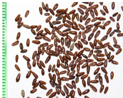
Figure 27 Plantago indica (144)