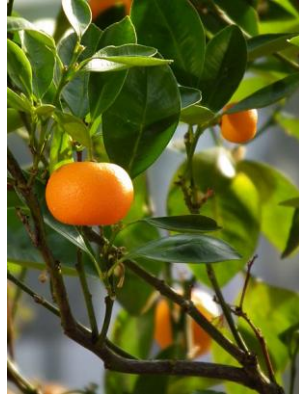
Figure 31 Citrus reticulata (161)

Le zeste de mandarine est utilisé depuis très longtemps en Asie pour calmer les maux d'estomac et les embarras gastriques. L'HE obtenue à partir des zestes est riche en limonène et possède des propriétés antispasmodique, tonique et protectrice gastrique, cholagogue, stimulante digestive et eupeptique. Elle facilite donc la digestion et améliore le péristaltisme intestinal. L'HE de mandarinier est notamment indiquée dans les cas de digestions lentes, aérophagie, hoquet, gastralgies, excès alimentaires, nausées... (50,162)