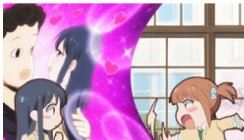
Figure 19: un personnage frappe un décor pour effectuer la transition entre deux scènes (Love Lab, épisode 1).

tandis que les pensées du personnage, qui illustrent son stratagème farfelu apparaissent en arrière-plan. Lorsque son amie l'interrompt pour la contredire, elle frappe l'image d'arrière-plan, aussitôt remplacée par le décor qu'elles occupaient auparavant (Figure 19). La discussion se poursuit ensuite avec les interlocutrices représentées avec leur character design habituel. Malgré la différence stylistique entre les personnages, l'image multiplane permet d'intégrer ce changement vif d'images à une dynamique rythmique.