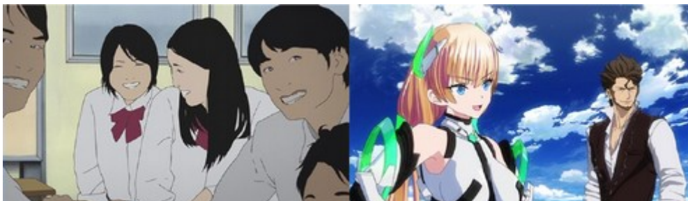
Figure 8: captures d'écran issues d'Aku no Hana (à gauche) et Escape from Paradise (à droite) (SUAN, Stevie, « Anime's Performativity: Diversity through Conventionality in a Global Media-Form », op. cit., p. 69).

tenue moulante portée par l'héroïne ou les différences des yeux du personnage féminin (gros) et masculin (petit). Dans le cadre d'une série développée via le media mix , obéir à l' anime-esque est important, car il est garant des propriétés attractionnelles du personnage qui amènent le consommateur d'un produit à un autre qu'il s'agisse de manga , d' anime , mais aussi de posters , de CD ou de figurines.