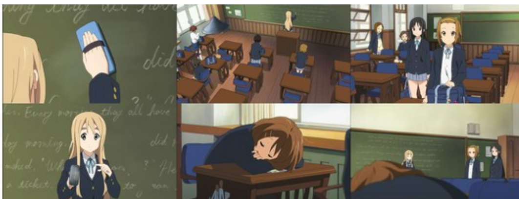
Figure 22: six plans successifs d'une séquence d'ouverture d'un épisode de K-ON!! , qui montrent comment la série spatialise son action ( K-ON!! , épisode 2).

La différence que creuse cette série avec Lucky Star se révèle tout particulièrement lorsque sont comparées deux séquences similaires tirées de l'une et l'autre de ces œuvres. La place accordée à la salle de classe, dans l'ouverture de l'épisode 2 de K-ON!! , peut être assimilée à celle de la discussion autour d'un cornet au chocolat dans le premier épisode de Lucky Star , en raison de la durée du passage et parce que la scène ne se focalise pas uniquement sur un gag. Les deux scènes montrent comment, dans la longueur, il existe différentes manières de représenter une discussion dans une salle de classe. Formellement, je constaterai des différences fondamentales en termes de découpage, qui montrent les spécificités des caractéristiques formelles de K-ON!! .