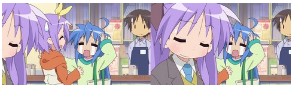
Figure 11: l'apparition de Kagami dans le cadre s'effectue par un dessin glissé vers la droite. ( Lucky Star , épisode 14).

Il ne faut pourtant pas penser que l'image multiplane dans l'animation limitée est uniquement le résultat de contraintes économiques. Par exemple, un passage du quatorzième épisode de Lucky Star représente de façon particulière l'arrivée soudaine de Kagami, qui réagit au désarroi de Konata. Au lieu d'animer le mouvement du personnage rejoignant la scène, Kagami est représentée comme si elle glissait dans le cadre (Figure 11). Elle apparaît dans une pose figée, qui donne immédiatement à voir sa réaction. La séquence utilise l'imaginaire de l'image fixe pour servir une dynamique et une rythmique gaguesques, il s'agit d'un comique propre à l'animation limitée et d'une des fantaisies permises par l'image multiplane. Cet exemple, couplé à ceux de Spriggan et Steamboy , permet de comprendre que l'image multiplane ne fait pas qu'illustrer les limites du cinéma d'animation en ce qui concerne la représentation des espaces. Il s'agit, avant tout, de repenser l'agencement dudit espace où se créent des effets propres à l' animetism .