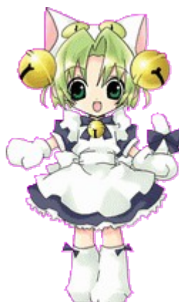
Figure 1: le personnage Di Gi Charat (En ligne : http://www.broccoli.co.jp/dejiko/chara.php , consulté le 9 septembre 2019).

sont tellement récurrentes qu'il est désormais impossible de désigner précisément une œuvre fondatrice.