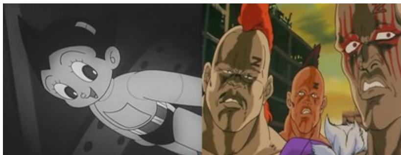
Figure 7: le robot Astro (Astro Boy, 1963, épisode 1) ou les antagonistes de Ken le survivant (1984-1988, épisode 1) sont deux représentations d'un imaginaire mangaesque ou anime-esque .

Pour autant, ses similitudes graphiques avec d'autres manga dans le dessin des hommes (aux traits durs et aux petites pupilles), comme Sakigake!! Otokojuku (Akira Miyashita, 1985-1991) ou Racaille Blues (Masanori Morita, 1988-1997), font que la série reste ancrée dans une image commune du manga , dans le mangaesque . Le lien entre le mangaesque et Tezuka permet simplement de situer les éléments d'attraction moe qui composent le modèle base de données avec un riche héritage issu des anime et des manga .