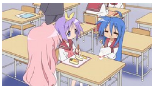
Figure 23: lors de ce plan, Lucky Star montre les personnages plus ancrés dans un décor en profondeur tout en conservant sa graphie dépouillée caractéristique ( Lucky Star , épisode 1).

La différence que creuse cette série avec Lucky Star se révèle tout particulièrement lorsque sont comparées deux séquences similaires tirées de l'une et l'autre de ces œuvres. La place accordée à la salle de classe, dans l'ouverture de l'épisode 2 de K-ON!! , peut être assimilée à celle de la discussion autour d'un cornet au chocolat dans le premier épisode de Lucky Star , en raison de la durée du passage et parce que la scène ne se focalise pas uniquement sur un gag. Les deux scènes montrent comment, dans la longueur, il existe différentes manières de représenter une discussion dans une salle de classe. Formellement, je constaterai des différences fondamentales en termes de découpage, qui montrent les spécificités des caractéristiques formelles de K-ON!! .