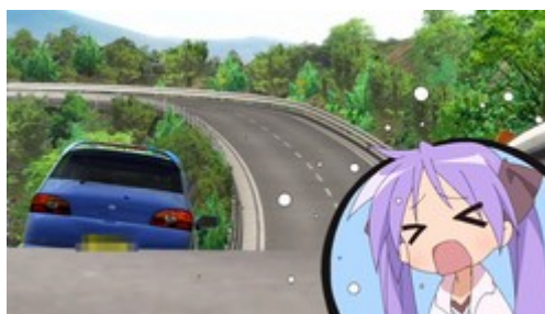
Figure 6: l'image de Kagami se superpose au décor dans un cadre en forme de bulle le temps d'un gag. ( Lucky Star , épisode 6).

Ces effets de projection dans l'espace, qui s'appuient sur les technologies informatiques sont difficiles à reproduire en prises de vues réelles. Toutefois, il est possible, comme dans le cas du film Spider-Man (Sam Raimi, 2002) que Lamarre référence, de réunir des plans en prises de vues réelles avec des effets spéciaux numériques 129 . L'espace est reconstruit a posteriori , par une intégration du personnage à un décor, qui « recrée de toutes pièces une idée de présence et d'emplacement 130 » associée aux espaces numériques. L' hypercinématisme conjugue, de fait, un imaginaire de la projection dans l'espace propre au cinématisme et celui des effets spéciaux numériques qui permettent la création d'espaces composites. Contrairement au cinématisme , l' hypercinématisme de Lucky Star n'est pas directement associé à un imaginaire de la prise de vues réelles, puisque le principe de la composition d'image est similaire aux techniques composites à l'œuvre dans l'animation. Au contraire, le mouvement balistique vient servir la gestuelle exubérante du vendeur, associée à un imaginaire du shônen manga . L' hypercinématisme agit, dans Lucky Star , comme un mélange hétérogène entre le mouvement balistique et l'imaginaire des dessins animés de combat.