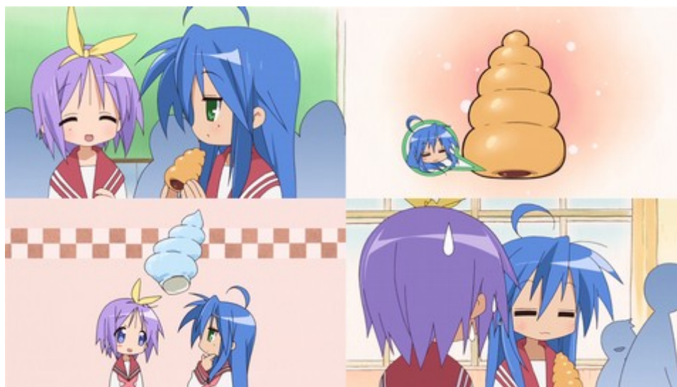
Figure 24: enchaînement de quatre plans lors de la discussion autour des cornets au chocolat. La mise en scène des espaces est typique de Lucky Star , avec une alternance entre une classe apparaissant plate et des fonds colorés et composés de motifs ( Lucky Star , épisode 1).

personnage de Mio est vu, lui aussi, par les autres personnages, comme une figure attractionnelle, au point qu'elle finit par avoir son propre club de fans. Dans l'épisode 4 de la première saison, lorsque ses amies l'observent s'attrister, le contraste entre sa fermeté habituelle et la fragilité qu'elle déploie provoque une réaction immédiate chez ses amies, qu'elle verbalise en utilisant les adjectifs « kawaii » et « moe ». Une pensée différente de l'hégémonie de l'espace bidimensionnel dans les adaptations de yonkoma moe ne signifie donc pas une opposition au modèle base de données.