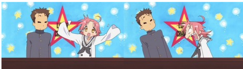
Figure 14: la double personnalité d'Akira s'exprime via un changement de character design (Lucky Star, épisode 14).

composés d'une succession d'images fixes 222 . De fait, le nombre limité d'images pour dépeindre le mouvement a permis l'émergence de différentes techniques ayant construit l'immobilité dynamique caractéristique des anime . Il ne faut pourtant pas croire que ces séries sont dénuées de toute séquence à l'animation fluide, malgré les limites de la production télévisuelle. Jacques Aumont le remarquait déjà dans Goldorak , lors des séquences de combat à robot, « donnant l'image d'une lutte fantastique et conventionnelle à la fois, aussi codée qu'une rencontre de judo, mais entre fantômes échappés de la dernière pièce d'une journée de nô 223 ». Alors que la série était encline à être saccadée, des passages particuliers se différencient par le dynamisme de ses mouvements. Lucky Star procède de la même manière en opposant son générique tonitruant à la tranquillité de la série. Tandis que les mouvements quotidiens des personnages sont dépeints avec simplicité, la chorégraphie effectuée par les héroïnes dans le générique va être animée plus en détail. L'apparition sporadique de mouvements plus fluides qu'à l'accoutumée donne un nouveau sens à l'animation limitée : il ne s'agit pas de montrer perpétuellement des mouvements saccadés, mais d'accorder une description soignée du mouvement à certaines scènes. En ce sens, l'animation limitée se distingue de l'animation pleine telle qu'employée par Miyazaki, où le mouvement est perpétuel.