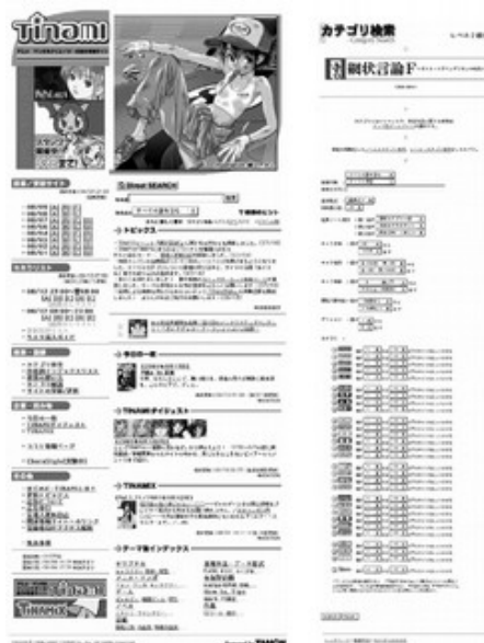
Figure 2: reproduction de la page d'accueil et l'outil de recherche de TINAMI (AZUMA, Hiroki, Génération Otaku, op. cit. , p. 77).

de cette image anonyme de D.J. Ko qui a amené la création d'une licence et d'un univers.