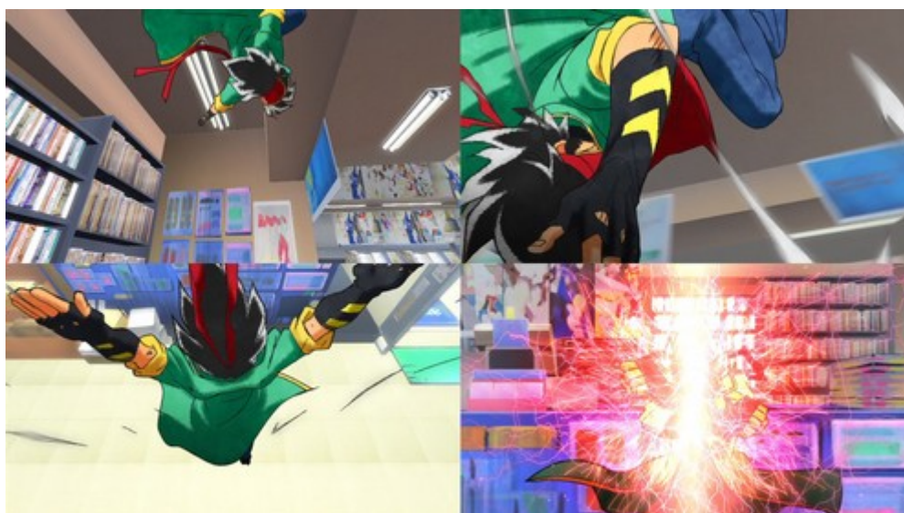
Figure 5: la caméra suit le mouvement exagéré de l'Anime TENCHÔ et l'adapte à un espace en trois dimensions (Lucky Star, épisode 10).

plus aisée à comprendre si l'on imagine la caméra comme une munition qui partirait d'un fusil pour arriver vers un ennemi. Les mouvements de caméra dans l'espace nous donnent à voir ce que serait le parcours d'une balle dans l'espace. Pour qu'il y ait une projection dans l'espace il faut qu'il y ait un projectile qui parte d'un point A pour arriver à un point B. Ce projectile, c'est la caméra. L'exemple illustrant concrètement le mouvement dans l'espace fondé sur le cinematism serait le travelling avant.