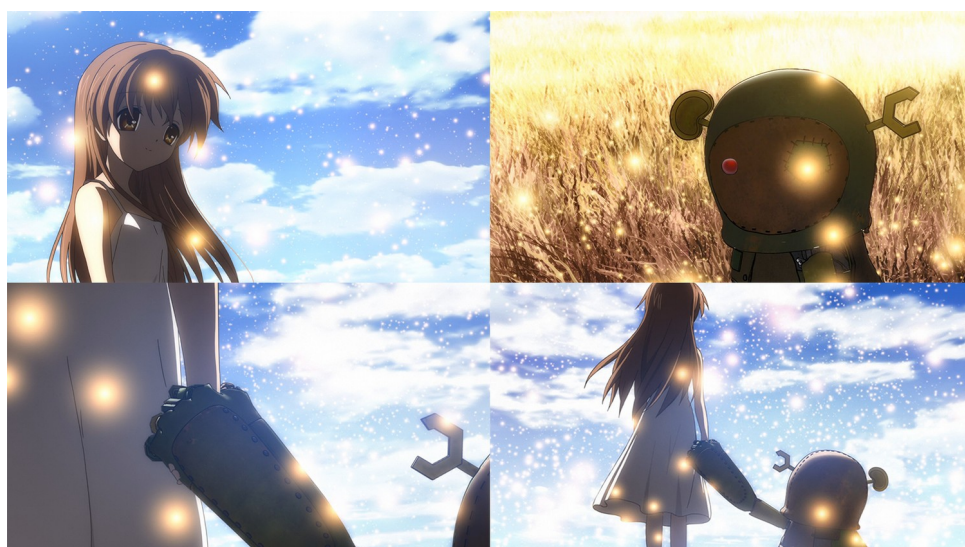
Figure 25: réunion dans un même cadre de la petite fille (bidimensionnelle) et du robot (tridimensionnel) accentuée par un jeu de lumière équivalent ( Clannad , épisode 15).

apparaît aussi lorsque le studio adapte le visual novel Clannad (2007-2009). Dans cet anime , un personnage de robot en image de synthèse cohabite dans un monde aux décors construits en profondeur et interagit avec une jeune fille qui, elle, apparaît comme un être bidimensionnel. De la même manière qu’avec K-ON! , les espaces vont être unifiés par un accord entre les mouvements de la caméra dans les espaces numériques à des corps dessinés, par un éclairage qui se reflète de la même manière sur le robot et la jeune fille ou par des teintes de couleurs équivalentes entre l’un et l’autre (Figure 25).