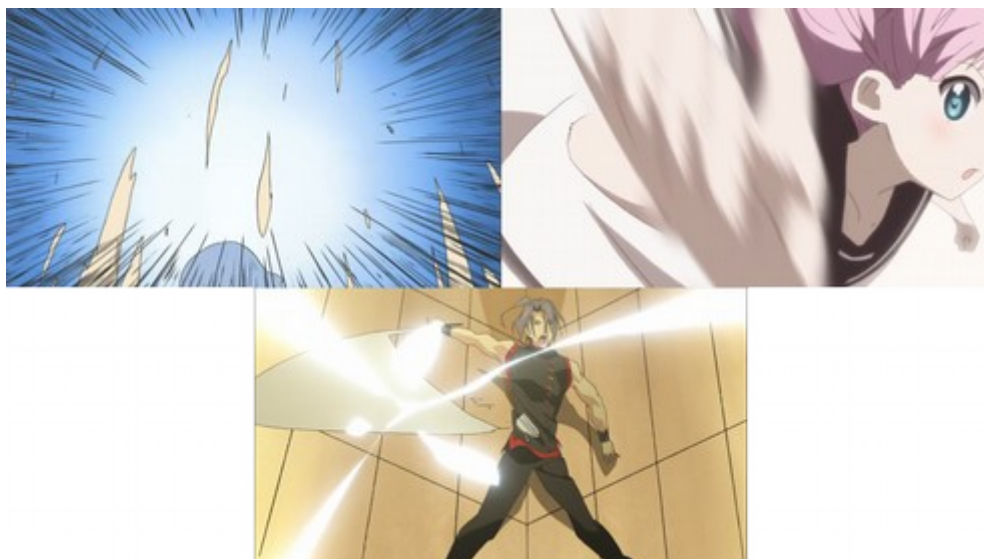
Figure 18: trois gestes smears similaires à ceux d'Akira et Minoru dans Lucky Star : celui d'un poing dont la vivacité apparaît via des intervalles (Nichijō, épisode 9), du flou d'une main dans un mouvement latéral ( Yuruyuri ♪♪, épisode 9) ou d'une épée brandie à toute vitesse ( Tantei Opera Milky Holmes , épisode 10).