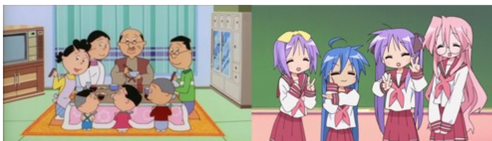
Figure 4: à gauche, la famille de Sazae ( Sazae-san , épisode 5802), à droite, Tsukasa, Konata, Kagami et Miyuki ( Lucky Star , générique d'ouverture).