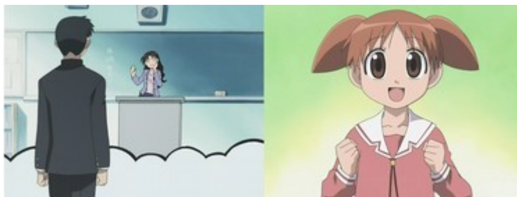
Figure 21: tout comme dans Lucky Star , les personnages et les décors d' Azumanga Daioh sont parfois extrêmement simplifiés ( Azumanga Daioh , épisode 1).

totallement ignorés 252 ». La composition de l'image séparant graphiquement les héroïnes et les figurants s'explique ainsi par une volonté d'aller à l'essentiel, propre au médium original dont est tiré l' anime . Si ce type d'adaptation domine, il convient toutefois d'étudier les cas marginaux qui, sans s'émanciper de leur matériel original ou d'une structure préalablement établie, s'en distancent dans leur forme.