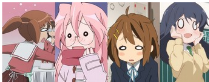
Figure 15: utilisation des yeux en soucoupe pour exprimer la surprise et la gêne. De gauche à droite : Azumanga Daioh (épisode 1), Lucky Star (épisode 10), K-ON! (saison 2, épisode 2) & Love Lab (épisode 1).

lycéennes suivi habituellement par le spectateur, en particulier Akira et ses multiples personnalités. Cela s'exprime très clairement à l'image dans le segment de l'épisode 14. Après que l'on a oublié d'inclure son personnage dans la partie principale de l' anime , elle finit par ne plus cacher son véritable caractère à l'écran. Elle reprend toutefois sa personnalité d' idol lorsqu'elle décide de faire du lobbying auprès des spectateurs pour apparaître dans le segment principal (Figure 14a), un état qu'elle perd aussitôt que son partenaire lui fait le moindre commentaire (Figure 14b). Cette personnalité affecte directement son apparence physique, notamment ses larges pupilles, qui finissent par ne ressembler qu'à de petits points, et sa bouche, qui déforme son visage. La séquence nous permet de comprendre qu'un changement de personnalité se traduit immédiatement par une transformation brutale dans le character design et par un mouvement particulier qui lui est associé.