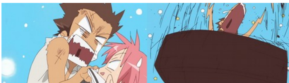
Figure 17: la colère de Minoru le transforme graphiquement, lorsqu'il renverse une table (image de droite) les images d'intervalles accentuent la violence du geste par des traits très vifs (Lucky Star, épisode 21).

qu'aux gestes et retranscrivent lesdits gestes avec moins de précision. La logique d'expressions stéréotypées vient d'autant plus s'appuyer sur un imaginaire expressif propre aux mondes « des manga et des dessins animés » qui ne s'attache pas à un souci de vraisemblance réaliste. En ce sens, elle s'éloigne d'une école américaine de l'animation du personnage. Dans un article de son blog, l'animateur John Kricfalusi 228 oppose une représentation convenue des sentiments, qui correspond à des critères d'efficacité, à celle qui s'accorde au ton d'une scène et à la créativité de l'animateur 229 . Dans le système des anime où les émotions sont préfabriquées, il est difficile d'imaginer un geste qui ne répondrait pas à des codifications graphiques issues du modèle base de données. De même, Preston Blair 230 précise qu'en animation, le personnage est envisagé comme un acteur, dont la représentation graphique est réglée sur la vie réelle 231 . Dans le modèle base de données, la ritualisation des gestes des personnages empêche la création d'une émotion qui ne serait pas réglée par une représentation préalable. Par une animation plus ample des gestes, qui s'appuie sur un souci de réalisme, Miyazaki essaye pour sa part de retranscrire sa vision de la réalité.