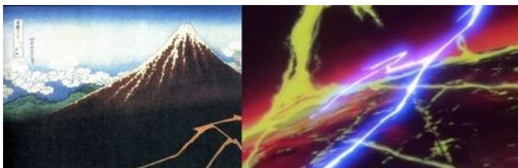
Figure 12: Murakami juxtapose, dans son catalogue Superflat , une vue du mont Fuji d’Hokusai avec une image tirée d’une séquence de Galaxy Express 999 animée par Yoshinori Kanada (image originale à droite) (LAMARRE, Thomas, The Anime Machine , op. cit., p. 178).

Cet art de la bidimensionnalité est nommé par Murakami superflat , c’est-à-dire le « super plat » ou la « super platitude ». Lamarre définit cette image « super plate » en évoquant sa potentielle conception : « Pour rendre quelque chose super plat [ superflat ], vous devez commencer par créer une disposition en couches qui introduisent la possibilité d’une profondeur et la détruire 210 ». Ces méthodes rappellent les procédés de l’image multiplane, où la multiplicité des calques crée un espace en couches propre à l’animation et non de la profondeur. Il rappelle aussi que l’ animetism montre, lui aussi, la platitude des espaces qui composent son image via l’intervalle animetic . La manière dont Lucky Star ne pense pas le personnage en adéquation totale avec un décor en volume, les séparant pour mieux créer un imaginaire de couches plates, permet l’intégration des effets graphiques issus des manga . Encore une fois, les rapports entre cette esthétique et le modèle base de données se comprennent mieux en prenant en compte l’agencement du personnage en différents éléments d’attraction disparates, fusionnés en une figure purement bidimensionnelle.