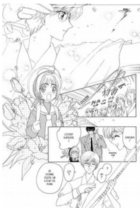
Figure 10: la mise en page de Sakura, chasseuse de cartes créer un espace graphique fantaisiste et émotionnel, affranchi d'une notion d'espace vraisemblable.

qui achève une longue discussion au téléphone. Lorsque l'adolescente apprend que la personne avec qui sa parente échangeait était un télévendeur, le décor qui représentait la pièce de vie est recouvert par un fond bleu en un fondu enchaîné (Figure 9). Ce changement d'arrière-plan s'accorde à la gêne ressentie par Miyuki, il n'est plus là pour contextualiser l'action, mais pour représenter l'émotion d'un personnage et pour ponctuer un gag. Cette conception expressive des arrière-plans est héritée des manga , où les séquences émotionnelles sont accompagnées de trames faites de bulles, d'étoiles ou de roses. Ces codifications sont particulièrement visibles dans les manga shôjo , où les trames et effets ornementaux s'accordent aux sentiments des personnages et servent une « rhétorique de l'émotion 192 ». Une page du premier tome du magical girl Sakura, chasseuse de cartes (CLAMP, 1996-2000) montre comment se mettent en scène ces effets. Lorsque l'héroïne voit l'adolescent dont elle est amoureuse tirer à l'arc, son émotion est accompagnée de plusieurs ornements (bulles, fleurs...). De même, la mise en page appuie d'autant plus la séparation entre décors et personnages, puisque les personnages s'affranchissent des limites fixées par les cases et sont parfois simplement représentés sur un fond blanc (Figure 10).