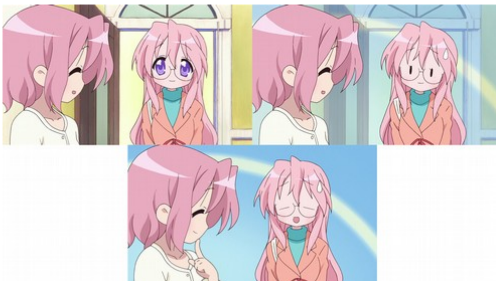
Figure 9: la réaction de Miyuki s'exprime graphiquement, par l'apparition d'un nouveau décor ( Lucky Star , épisode 14).

des comparaisons entre les anime et le kamishibai , qui désigne un art théâtral destiné aux enfants où un conteur narre une histoire accompagnée d'images illustratives 190 . Pour autant, il ne faut pas réduire l'animation limitée à un art de la fixité, car, comme le remarque Thomas Lamarre : « Il est impossible de comprendre le dynamisme des réseaux des anime si l'on continue à penser l'animation sur le modèle du statisme ou de l'immobilité 191 ». La majorité des anime ne sont pas composés d'une succession d'images fixes et, si l'animation des corps a tendance à être limitée, l'idée du mouvement reste présente grâce aux cadrages dynamiques ou à la représentation de traits vifs qui évoquent la rapidité d'un geste. Les anime tendent simplement à s'appuyer sur des codifications graphiques héritées des manga .