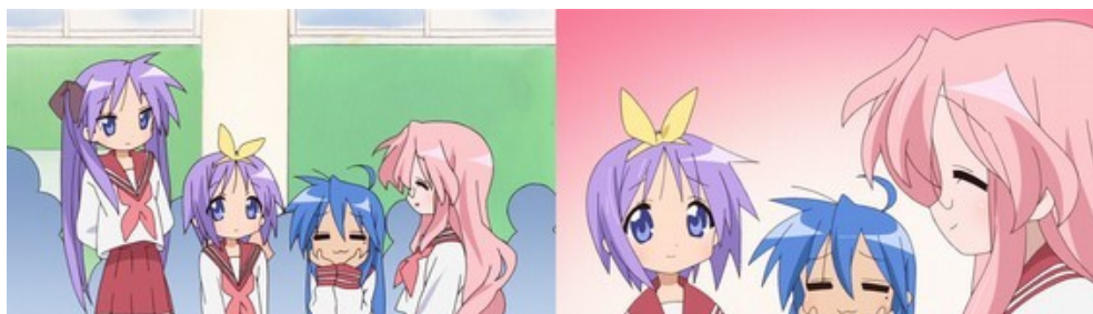
Figure 20: succession de deux plans lors d’une discussion dans Lucky Star . Sur le plan de gauche, l’absence de profondeur et la masse informe d’élèves en arrière-plan participent au même effet d’aplatissement que celui créé par le fond rose sur le plan droit ( Lucky Star , épisode 6).

Comme l’ont montré Tanaka et Okamoto avec la récurrence des lieux quotidiens et des pratiques de pèlerinage chez de nombreux fans d’ anime , la question des espaces traverse le nichijō-kei . Pour autant l’espace visité par les amateurs s’avère être fondamentalement différent de celui à l’œuvre dans ces séries, puisque Lucky Star ne pense pas réellement ses personnages comme s’ils s’ancraient en profondeur dans les décors. Comme je l’ai précédemment souligné, les plans dans Lucky Star ont tendance à être construits selon les principes de l’ animetism , où la division par couches d’images est clairement visible. Cette division est assumée dans la série, comme le montre l’intégration de nombreux effets graphiques qui se superposent au décor, comme avec la scène maintes fois évoquée où Miyuki discute avec sa mère (Figure 9).