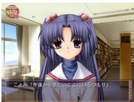
Figure 13: organisation visuelle du visual novel Clannad (2004).

Il est aussi intéressant de remarquer combien cette logique de dé-hiérarchisation s'applique à la culture otaku de façon générale. Car, si le superflat et l'image multiplane se sont élaborés grâce aux manga et anime , ces mêmes pensées s'appliquent aux visual novels , des productions informatiques qui offrent une illustration parlante du modèle base de données. Dans ces derniers, l'image s'organise en plusieurs couches, de la même façon qu'une image multiplane. Sur la première se trouvent les diverses informations textuelles et les nombreux boutons qui permettent au joueur d'interagir, sur la deuxième se trouve le personnage et sur la troisième l'arrière-plan. Exemple avec cette capture d'écran du jeu vidéo Clannad (2004) qui montre le personnage de Kotomi à la bibliothèque. Le personnage ne va pas s'ancrer dans l'espace, qui est construit selon une logique de ligne de fuite cartésienne et traduit une idée de profondeur, mais s'y plaquer. Il apparaît platement, placé au-dessus d'un arrière-plan, comme un autocollant. Ici, le décor n'a qu'une valeur contextuelle (Figure 13).