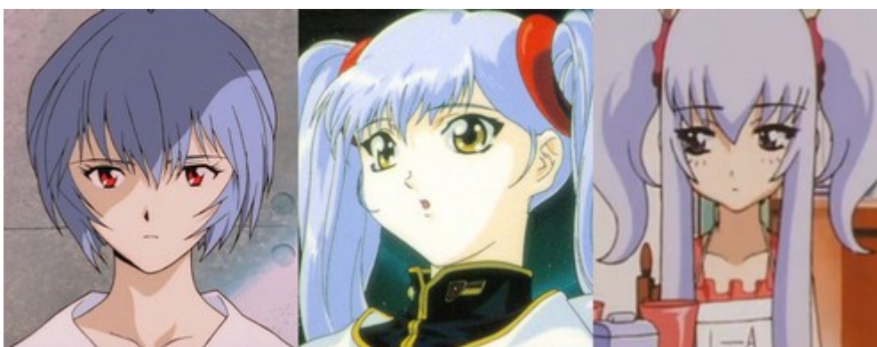
Figure 3: similitude entre, de gauche à droite, les personnages de Rei ( Neon Genesis Evangelion, générique d'ouverture ), Ruri ( Martian Successor Nadesico : Prince of Darkness, Tatsuo Satô, 1998 ) et Tsubame ( Cyber Team in Akihabara: Summer Vacation of 2011, Hiroaki Sakurai, 1999 ).

Ce qui fait attraction n'est pas seulement limité aux caractéristiques fétichistes des personnages. Les éléments d'attraction désignent plutôt une organisation stéréotypée d'un récit, composée d'éléments disparates de la culture otaku . Azuma illustre cette conception du récit stéréotypé avec les romans de l'écrivain Ryûsei Seiryôin. Ce dernier mêle le contexte d'un récit d'enquêtes avec des personnages aux super pouvoirs. Bien qu'il ne s'agisse pas d'un récit réaliste, il est perçu comme réel dans le monde « des manga et des dessins animés », où les récits réglés par de super pouvoirs sont nombreux. La résolution méthodique d'un mystère importe moins que les situations typiques qui l'ancrent dans le genre des récits d'enquête (les diverses astuces, la séquence de déduction...) 31 . Un imaginaire commun rend le récit crédible et les nombreux stéréotypes des romans d'enquêtes fondent son attractionnalité. De même, c'est l'imaginaire otaku , ancré dans le manga et l' anime , qui fait que ces enquêtes renvoient au modèle base de données.