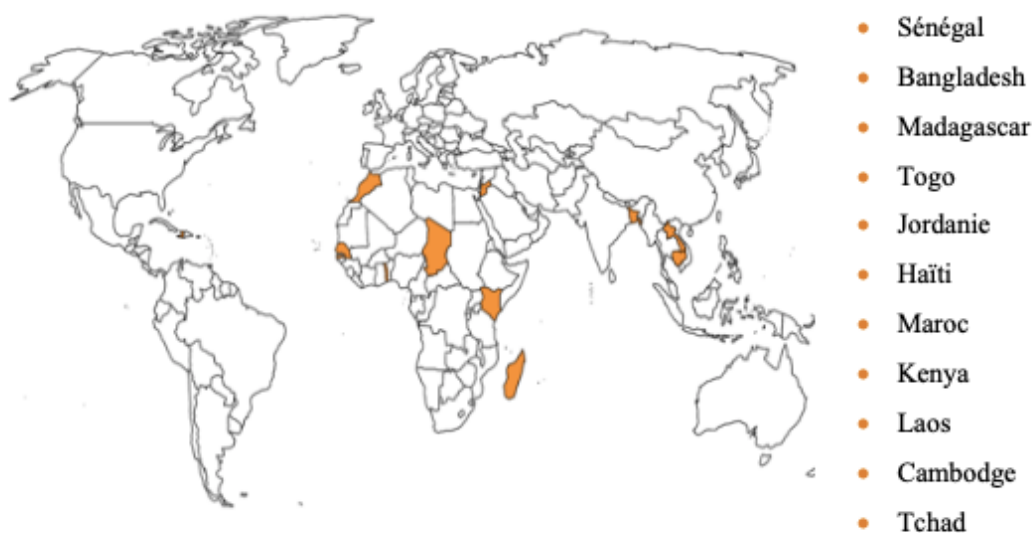
Pays d'affectation des sages-femmes parties en mission