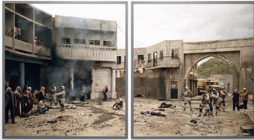
Figure 2 : Eric BAUDELAIRE, Dreadful Details , Berouth, photographie, 2006, CNAP collection

Il surprend à nouveau avec son œuvre Un film dramatique 88 , un long métrage coréalisé durant quatre ans avec vingt collégiens de Saint-Denis qui s’inscrit tout à la fois dans l’art vidéo, le documentaire, la fiction et l’histoire contemporaine. « La première chose était de trouver une manière à travailler ensemble 89 ». Éric Baudelaire estime avoir seulement collaborer à la création de ce film en invitant à la discussion, à la réflexion et en distribuant des caméras. Il parle d’ « une espèce de cinéma presque autodidacte qui se fabrique 90 ». A travers la création de cette œuvre, l’artiste vient « questionner ou mettre en crise la question de l’auteur. 91 » Le fait qu’Eric Baudelaire soit en 2019 primé au prix d’art contemporain le plus influent de France avec une œuvre collaborative est un véritable événement. Cela vient légitimer à la fois les œuvres collaboratives et la place de l’artiste au plus près de la société. Mais alors quels sont les réels impacts d’une pratique collaborative sur les artistes ?