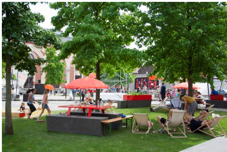
Figure 9 : La place Faidherbe, projet participatif mené par le collectif Faubourg 132, Roubaix, design, 2016

meublement urbain et surtout de la végétation. Il y a là une appropriation de l'espace par les habitants.