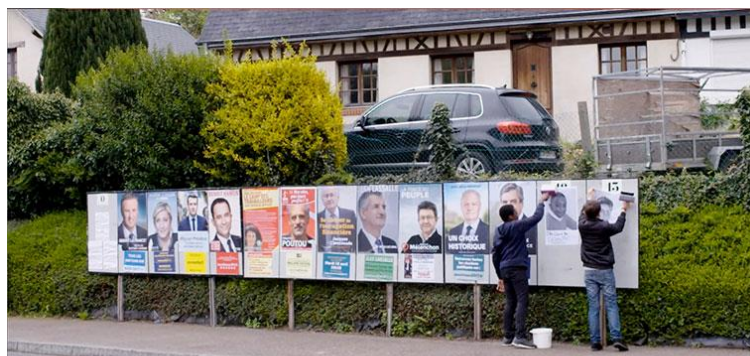
Figure 3 : Eric BAUDELAIRE, Un film dramatique , film, 2018

Il surprend à nouveau avec son œuvre Un film dramatique 88 , un long métrage coréalisé durant quatre ans avec vingt collégiens de Saint-Denis qui s’inscrit tout à la fois dans l’art vidéo, le documentaire, la fiction et l’histoire contemporaine. « La première chose était de trouver une manière à travailler ensemble 89 ». Éric Baudelaire estime avoir seulement collaborer à la création de ce film en invitant à la discussion, à la réflexion et en distribuant des caméras. Il parle d’ « une espèce de cinéma presque autodidacte qui se fabrique 90 ». A travers la création de cette œuvre, l’artiste vient « questionner ou mettre en crise la question de l’auteur. 91 » Le fait qu’Eric Baudelaire soit en 2019 primé au prix d’art contemporain le plus influent de France avec une œuvre collaborative est un véritable événement. Cela vient légitimer à la fois les œuvres collaboratives et la place de l’artiste au plus près de la société. Mais alors quels sont les réels impacts d’une pratique collaborative sur les artistes ?