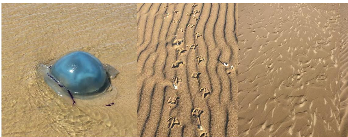
Figure 10 : Marche jusqu'au sémaphore de Sangatte, découverte du paysage à travers les divers motifs dessinés par le vent et l'eau

Leila Willis est une artiste plasticienne qui nourrit sa recherche de voyages et vient créer des ubiquités entre différents espaces et des mélanges culturelles. Elle s'attache aux mouvements, aux rythmes et au phénomène de multiplication. L'artiste affectionne tout particulièrement le monde marin avec un intérêt pour les changements d'échelle. Au cours de sa résidence, l'artiste s'est attaché à faire découvrir l'environnement du village vacances aux participants à travers les paysages et le monde marin. Leila Willis a également proposé un atelier autour du land art et des artistes de la marche comme Anish Pullton.