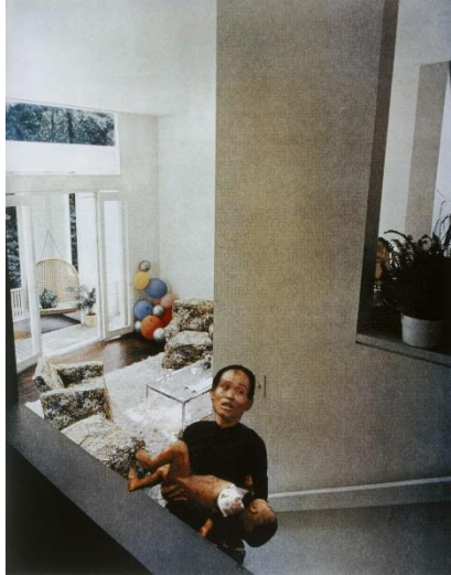
Figure 1 : Martha ROSLER, Balloons de la série House Beautiful: Bringing the War Home , photographie, 1967-72, MoMA collection