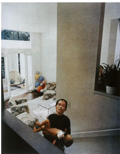
Figure 1 : Martha ROSLER, Balloons de la série House Beautiful: Bringing the War Home , photographie, 1967-72, MoMA collection