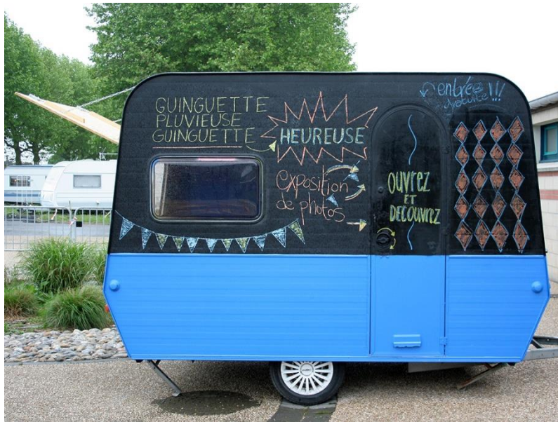
Figure 12 : Collectif Faubourg 132, projet Caravane Tour, Guinguette, Résidence M.i.A.A. 2016