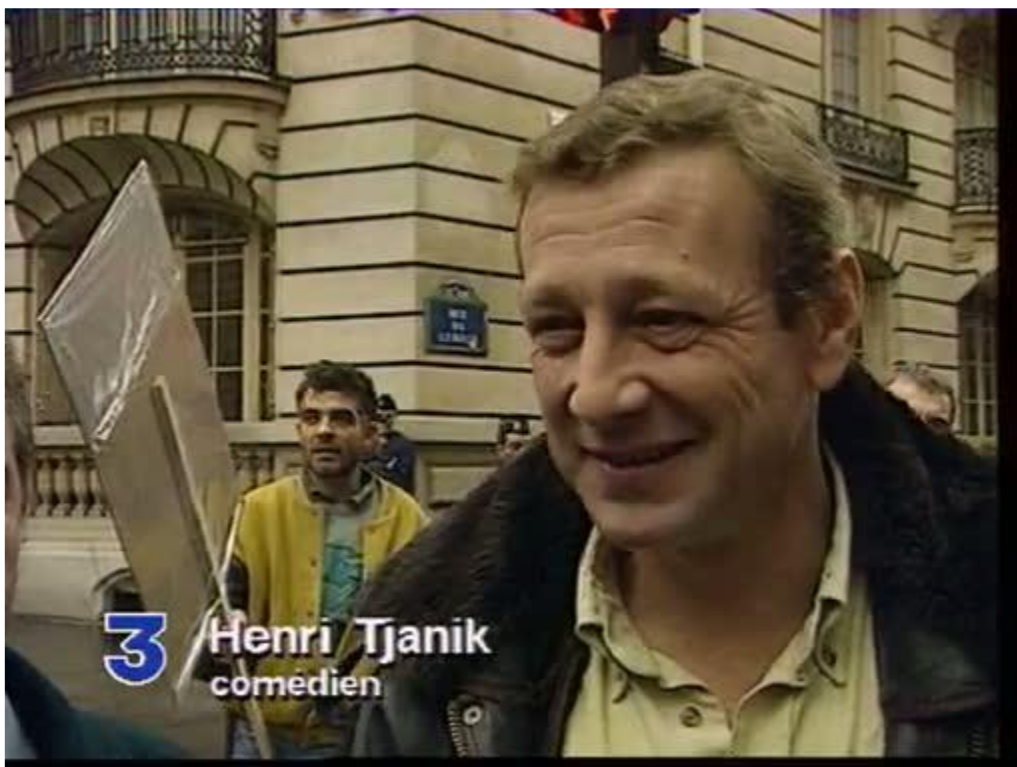
Journal télévisé 12 h 45, France 3 - 28.12.1994 - 13:23:59