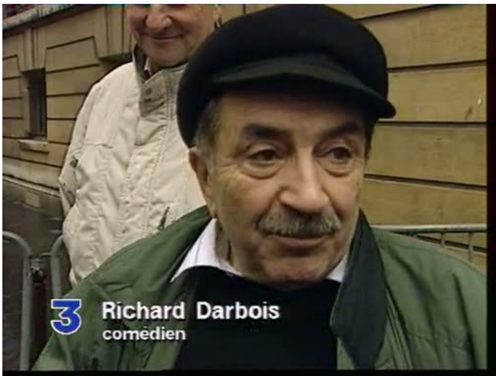
Journal télévisé 12 h 45, France 3 - 28.12.1994 - 13:23:54.