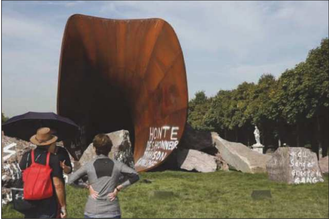
6. « Dirty Corner » œuvre de Anish Kapoor vandalisée dans les jardins du château de Versailles, le 11 septembre 2015.