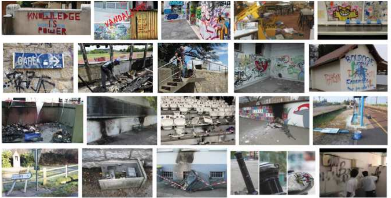
2. Vandalisme - Recherche Google image, p. 1, 07 octobre 2017