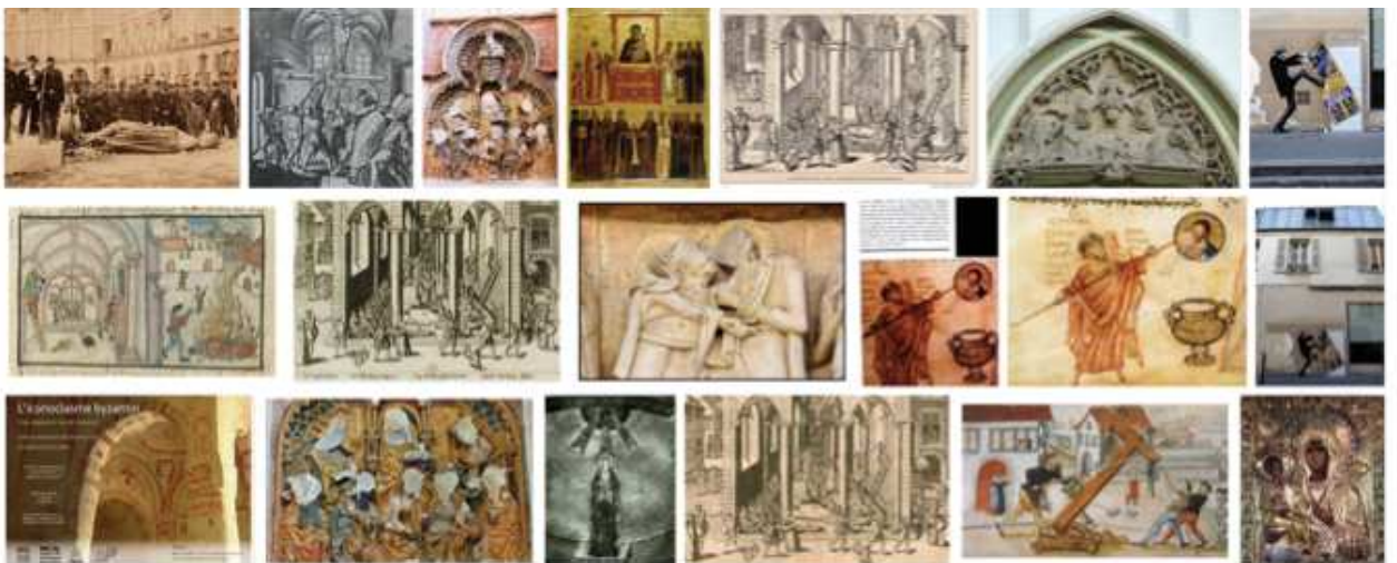
3. Iconoclisme - Recherche Bing image, p. 1, 07 octobre 2017

Les recherches d'images autour des deux notions laissent clairement apparaître les différences de représentation. Le vandalisme est immédiatement assimilé aux actes de malveillance dans les lieux publics et sur l'équipement urbains (tags, incendies etc.) ; l'iconoclisme, à la destruction des représentations religieuses.