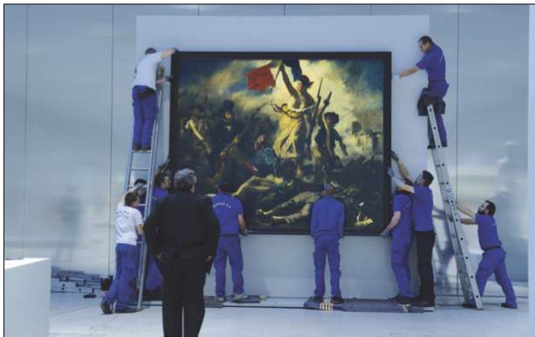
5. « La liberté guidant le peuple », Hubert Fanthomme. Source : Paris Match 08 février 2013.