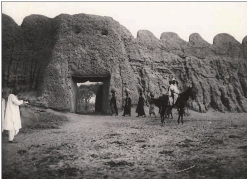
Entrée du birni de Zinder