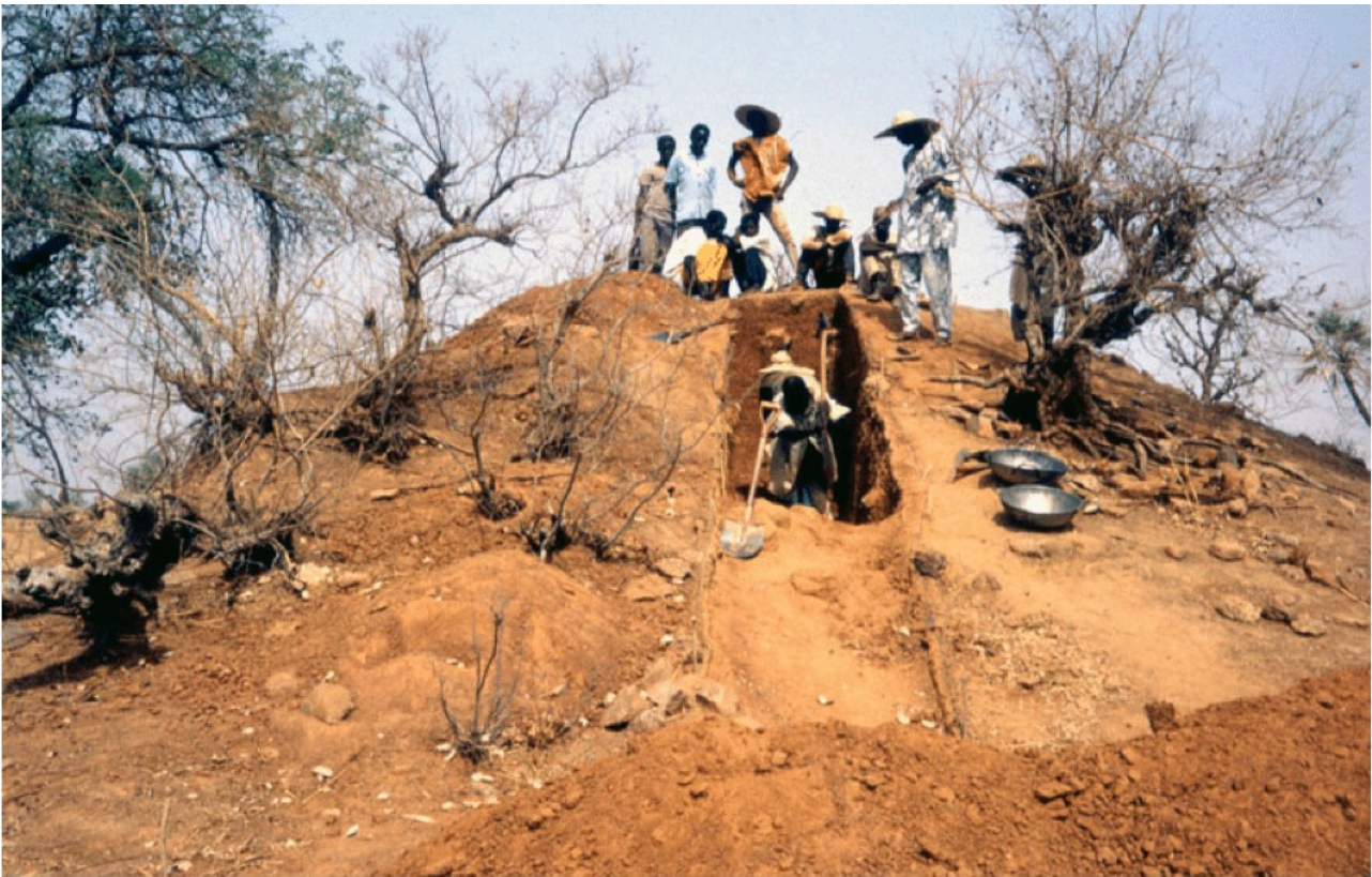
Tertre Funéraire (tertre n°2) à Durbi Takusheyi, 1992