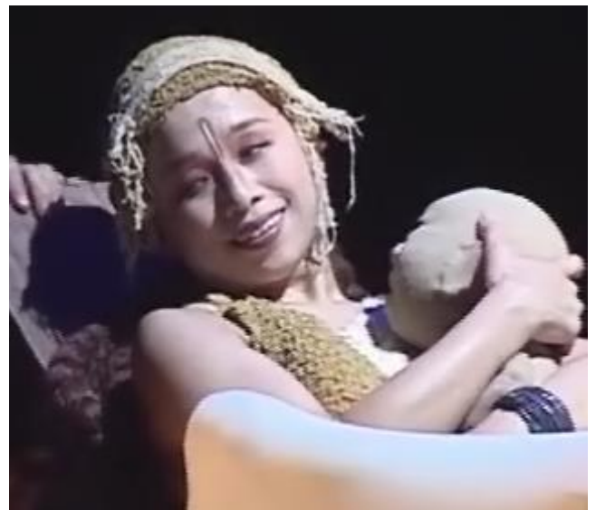
Figure 28 : visage de la femme après l'accouchement

Capture d'écran du spectacle Saudade-Terres d'eau à 00h 49min 43sec