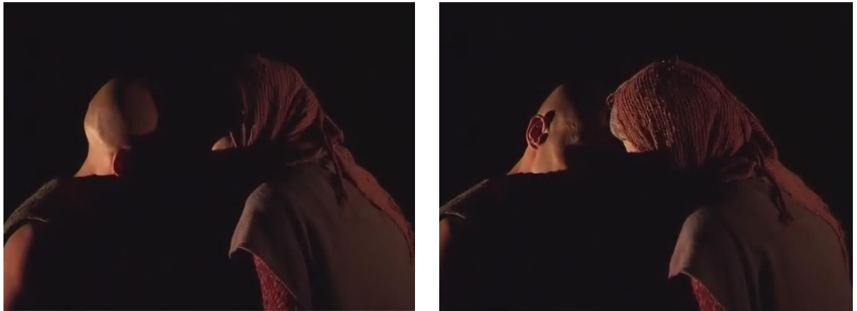
Figure 18 : la deuxième salutation

Capture d'écran du spectacle Saudade-Terres d'eau de 01h 11min 36sec à 01h 11min 37sec