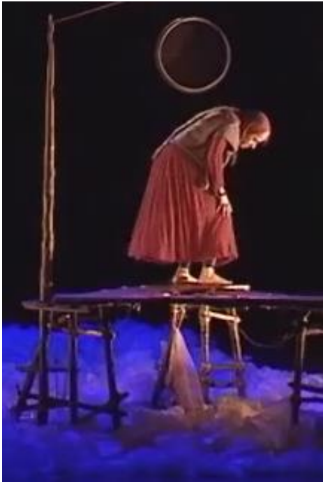
Figure 19 : le personnage de la mère – la posture

Capture d'écran du spectacle Saudade-Terres d'eau à 00h 01min 02sec