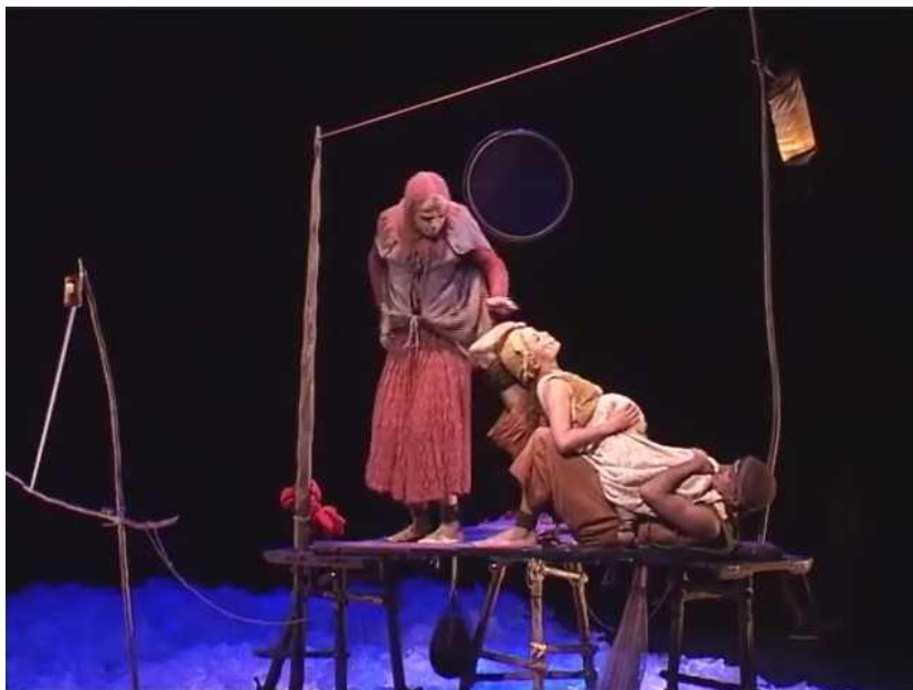
Figure 16 : la chaise longue

Capture d'écran du spectacle Saudade-Terres d'eau à 00h 18min 10sec