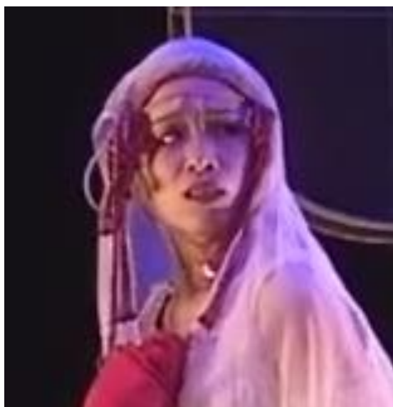
Figure 27 : visage de la femme avant le mariage

Capture d'écran du spectacle Saudade-Terres d'eau à 00h 12min 29sec