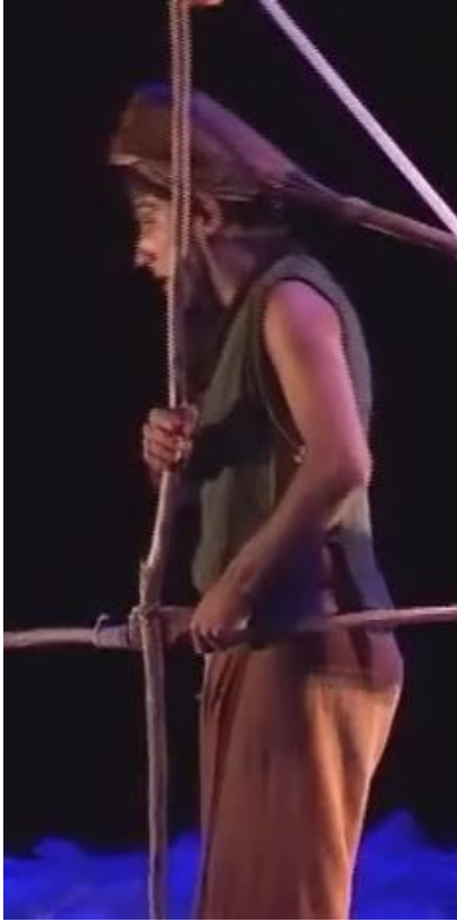
Figure 24 : posture du fils au début du spectacle

Capture d'écran du spectacle Saudade-Terres d'eau à 00h 22min 57sec