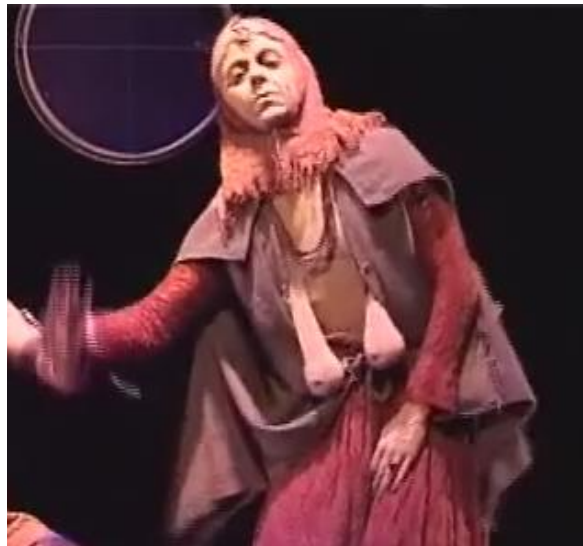
Figure 21 : le personnage de la mère – les seins

Capture d'écran du spectacle Saudade-Terres d'eau à 00h 04min 25sec