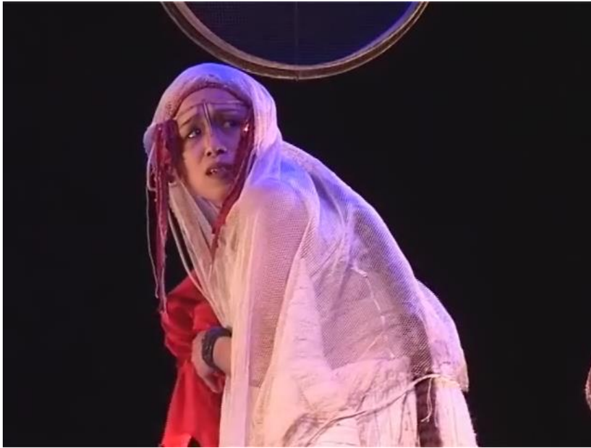
Figure 5 : la peur marquée sur le visage de la femme

Capture d'écran du spectacle Saudade-Terres d'eau à 00h 11min 46sec