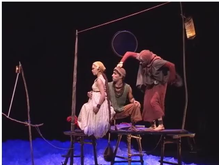
Figure 4 : La mère tourne la tête de son fils

Capture d'écran du spectacle Saudade-Terres d'eau à 00h 02min 02sec CURTI, André et RIBEIRO, Artur. Saudade - Terres d'eau Elancourt, juin 2005.