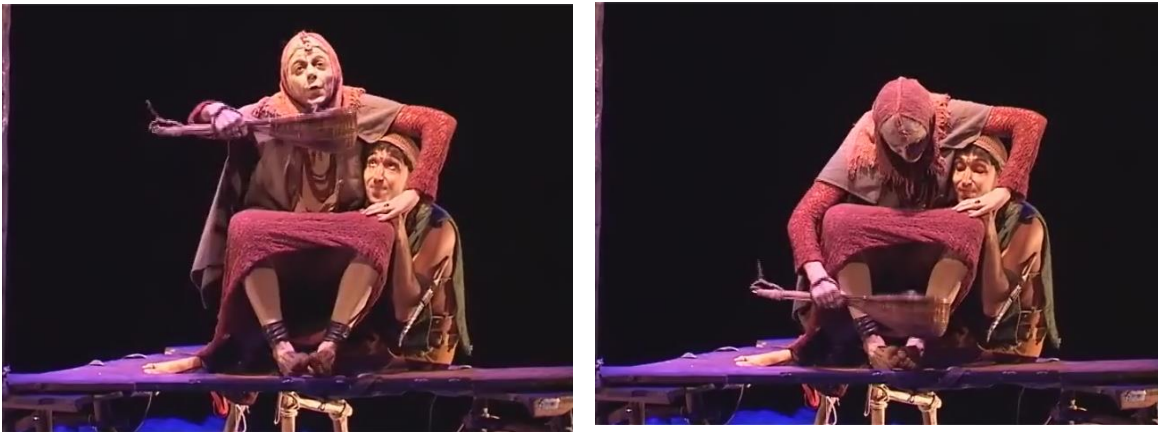
Figure 11 : la mère cuisine

CURTI, André et RIBEIRO, Artur, op. cit.