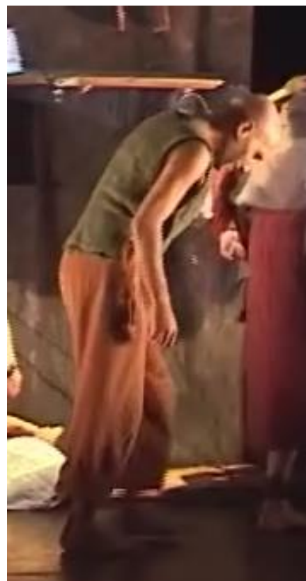
Figure 26 : posture du fils au retourner à la maison après avoir été arrêté

Capture d'écran du spectacle Saudade-Terres d'eau à 01h 12min 33sec