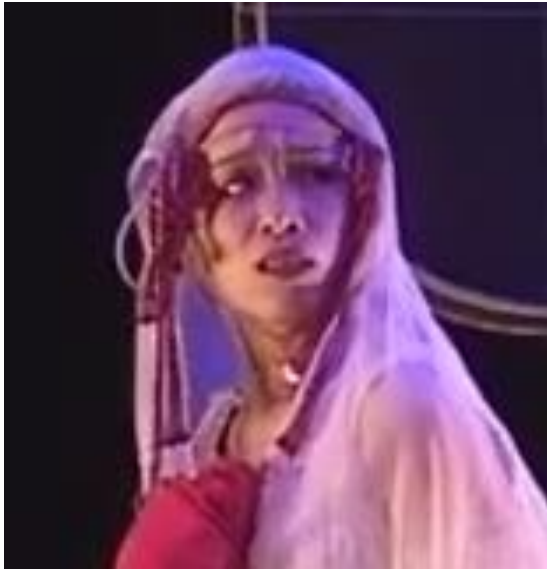
Figure 27 : visage de la femme avant le mariage

Capture d'écran du spectacle Saudade-Terres d'eau à 00h 12min 29sec