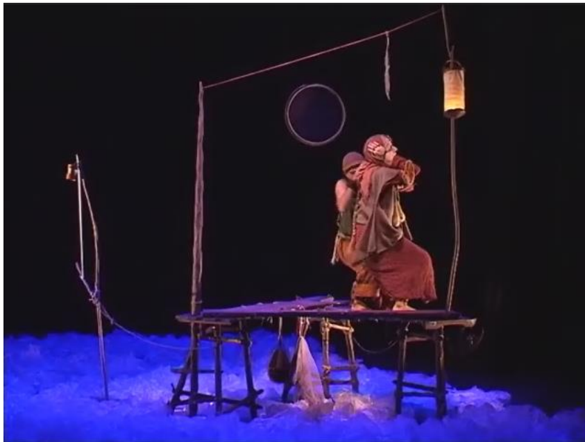
Figure 15 : la chaise

Capture d'écran du spectacle Saudade-Terres d'eau à 00h 04min 53sec