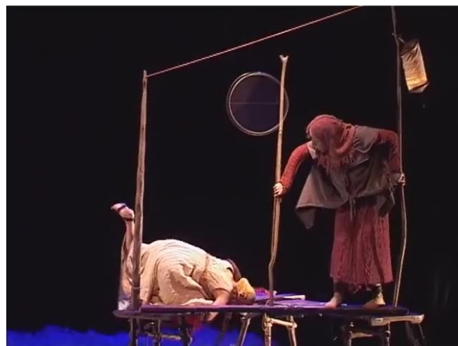
Figure 14 : le ménage

Capture d'écran du spectacle Saudade-Terres d'eau de 00h 10min 41sec à 00h 10min 43sec , Ibid.