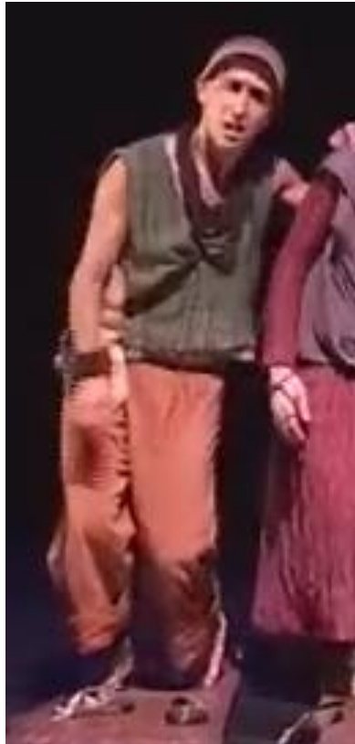
Figure 25 : posture du fils pendant le déplacement

Capture d'écran du spectacle Saudade-Terres d'eau à 00h 41min 16sec