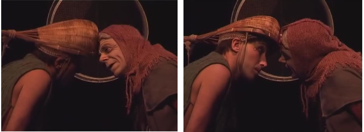
Figure 17 : la salutation

Capture d'écran du spectacle Saudade-Terres d'eau de 00h 01min 58sec à 00h 01min 59sec