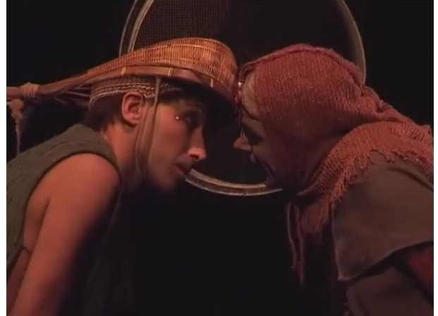
Figure 17 : la salutation

Capture d'écran du spectacle Saudade-Terres d'eau de 00h 01min 58sec à 00h 01min 59sec