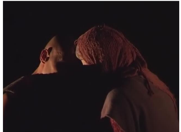
Figure 18 : la deuxième salutation

Capture d'écran du spectacle Saudade-Terres d'eau de 01h 11min 36sec à 01h 11min 37sec