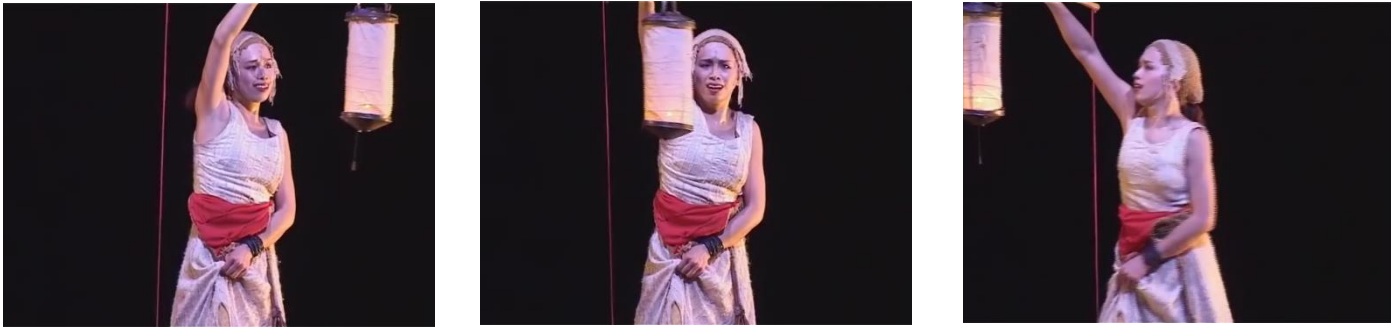
Figure 12 : des gens qui passent

Capture d'écran du spectacle Saudade-Terres d'eau de 01h 06min 47sec à 01h 06min 52sec , Ibid.