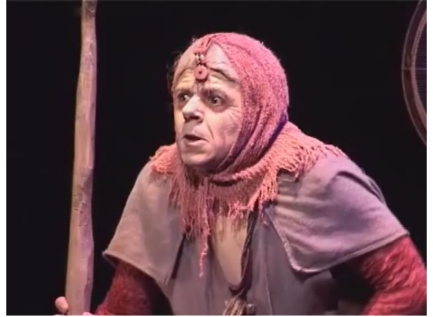
Figure 20 : le personnage de la mère – le visage

Capture d'écran du spectacle Saudade-Terres d'eau à 01h 08min 59sec