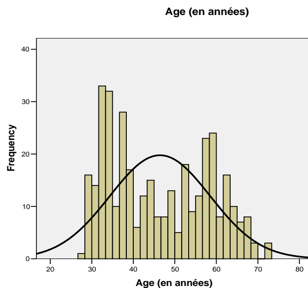
Figure 1 - Histogramme de l'âge de la population d'étude

Cette différence démographique importante sera discutée dans la section concernant la critique de la méthodologie plus bas, car en effet, elle a mis en lumière un biais de sélection dans la population interrogée, montrant qu'une part importante des médecins généralistes français n'a pas été atteinte dans le recrutement dans notre étude.