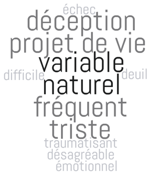
Figure 5 : Nuage des représentations des internes

Dans un premier lieu, nous pouvons observer le mot « variable » sur les deux nuages : la représentation de la fausse-couche serait variable selon les patientes. En effet, selon les professionnels, le vécu de la patiente serait différent selon le désir ou non de grossesse :