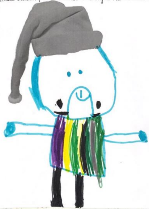
Image 15 : ikasleen ekoizpenak (xitxuketa numerikoa grafismoarekin)

C'est un tigre qui a volé le bonnet d'Argitxo.