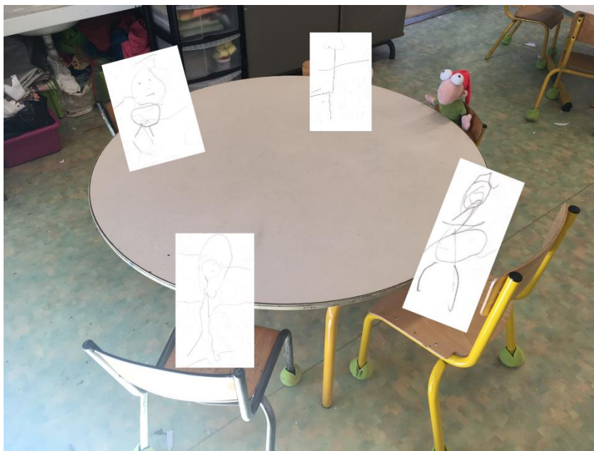
Image 16 : ikasleen ekoizpenak (xitxuketa numerikoa grafismoarekin)