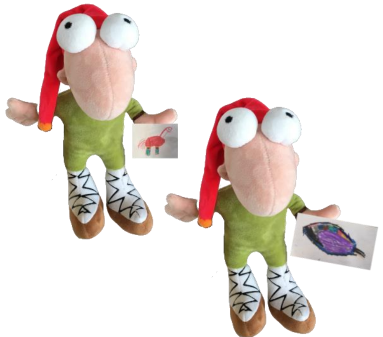
Image 14 : ikasleen ekoizpenak (xitxuketa numerikoa grafismoarekin)