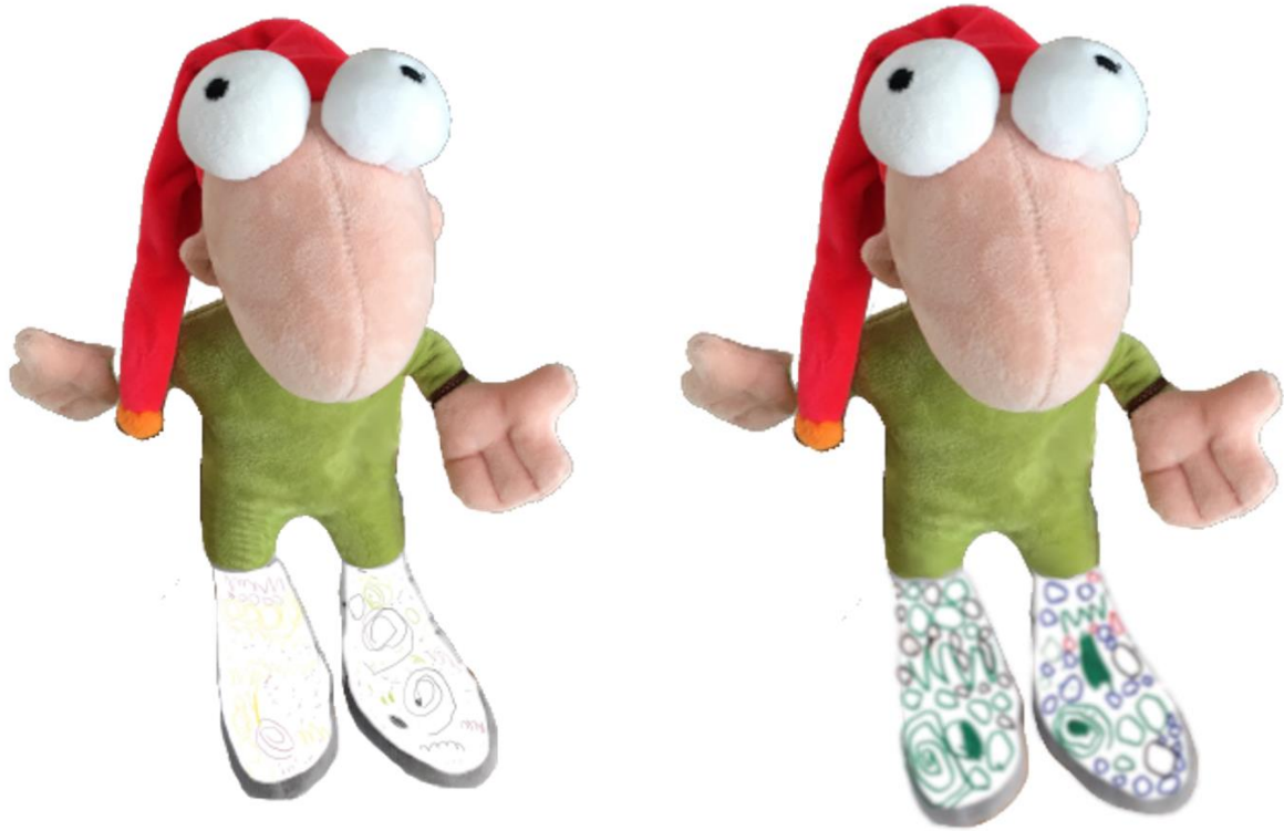
Image 17 : ikasleen ekoizpenak (xitxuketa numerikoa grafismoarekin)