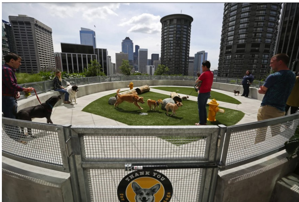
Figure 3 : parc à chien sur les toits des bâtiments de l'entreprise Amazon (González et Lambert, 2016)