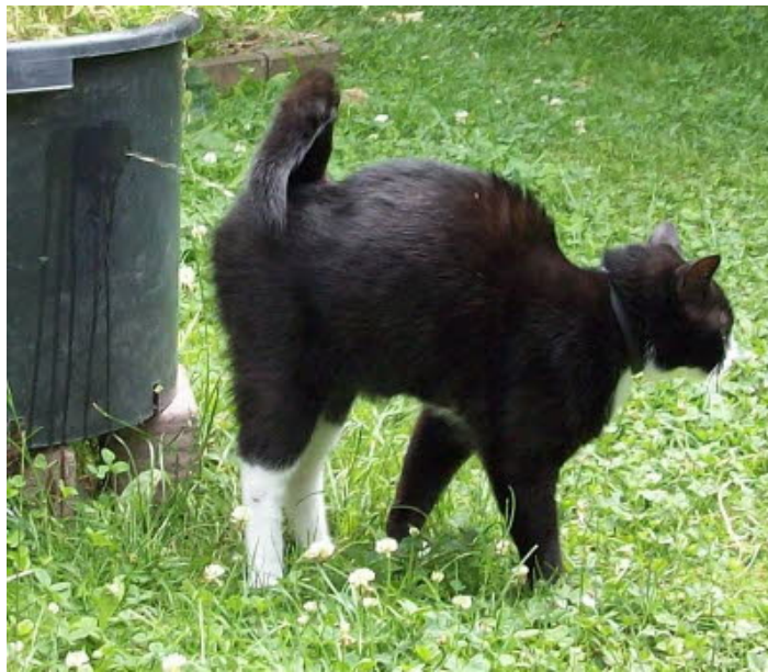
Figure 2 : comportement de marquage urinaire chez le chat. Contrairement à une miction normale, le chat a les pattes arrières tendues et émet un jet très odorant en hauteur sur une surface verticale (Catapart.fr, 2022)

comportement de marquage que de la malpropreté mais la première étape consiste à l'identifier. Les connaissances actuelles suggèrent que la stérilisation des chats réduit les comportements de marquage mais que le stress social les augmente (Horwitz, 2019).