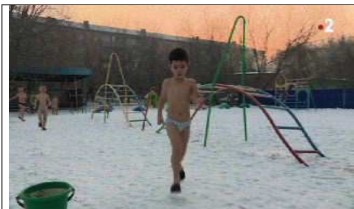
“Douche froide à l'école maternelle”, le 20h - France 2 - 11/2/2018

Le froid n'est ainsi pas seulement un élément d'ambiance, ou un référent géographique. Porteur d'une connotation d'extrême, support de scènes et d'échanges relevant de l'insolite, il permet aussi à la narration d'adopter un ton interloqué, voire impressionné, face à l'altérité du Russe. Le froid et son omniprésente mention disent quelque chose des Russes, et de la dureté de la vie en Russie. Ainsi, le suggère peut-être, ce commentaire de D. Derda sur le reportage « Douche froide dès l'école maternelle » :