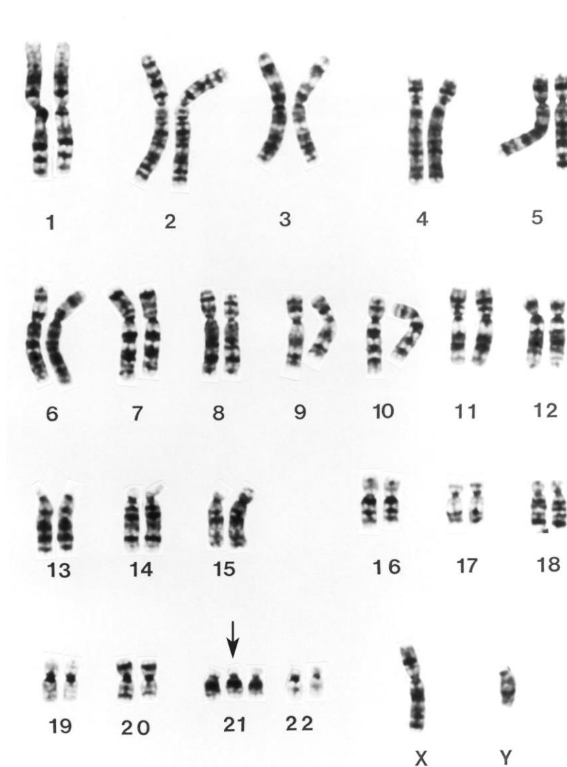
Figure 1 – Caryotype de T21 (7)

La T21 est une aneuploïdie autosomique, définie par la présence, en partie ou en totalité, d'un 3 e exemplaire du chromosome 21.