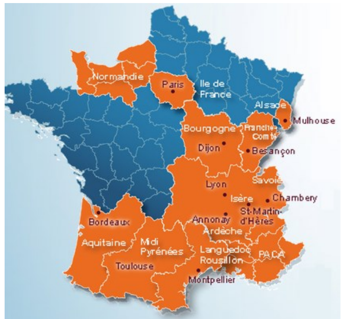
Carte des régions couvertes par un Réppop.

Les Réseaux de Prévention et de Prise en charge de l'Obésité Pédiatrique (Réppop) ont été créés en 2002, dans le cadre du premier PNNS. Les formes antérieures de prise en charge médicale, comme les Maisons d'enfants à caractère social, n'avaient pas d'effets durables sur la corpulence des jeunes obèses (Perrin 2014), et la prise en charge ordinaire par les médecins traitants et pédiatres souffre de plusieurs difficultés que les Réppop veulent venir combler, entre autres le manque de formation initiale sur le sujet (Peretti-Watel 2011) et le découragement découlant de la faiblesse des effets de la prise en charge (Kansra et al. 2021). Les Réppop sont désignés par le Plan Obésité (2010-2013) comme des partenaires privilégiés pour établir un diagnostic territorial et structurer la prise en charge et sa coordination. Il s'agit pour la plupart d'associations loi 1901, financées de 70 à