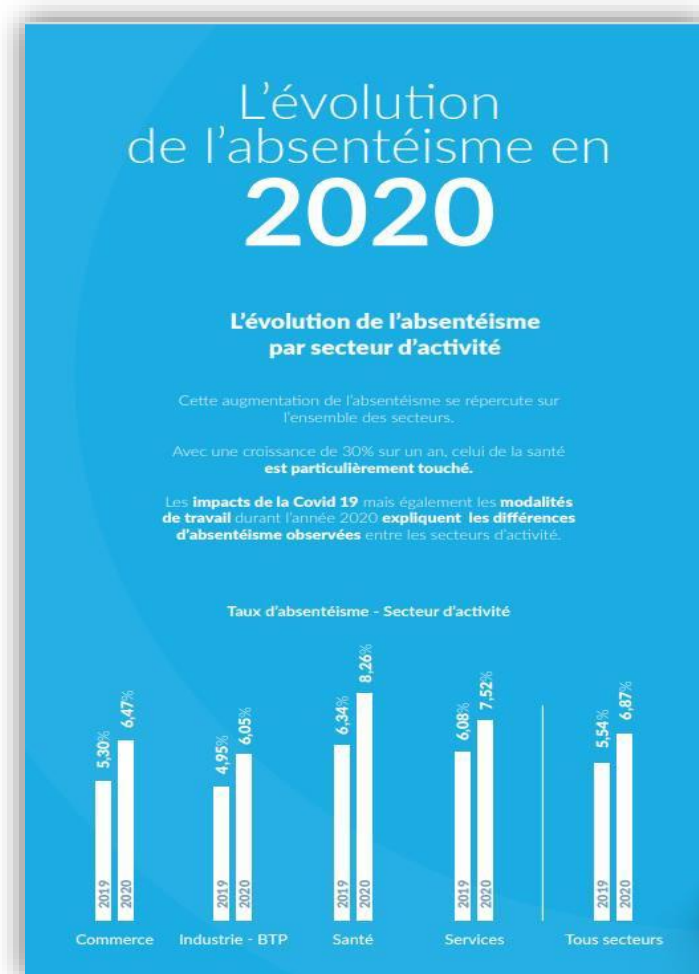
Figure 1 : baromètre de l'absentéisme au travail et de l'engagement (Ayming,2020)

L'ANACT, Agence Nationale pour l'Amélioration des conditions de Travail, considère que « L'absentéisme caractérise toute absence qui aurait pu être évitée par une prévention suffisamment précoce des facteurs de dégradations des conditions de travail entendus au sens large : les ambiances physiques mais aussi l'organisation du travail, la qualité de la relation d'emploi, la conciliation des temps professionnel et privé, etc. ». Cette définition identifie la seule responsabilité de l'entreprise tant dans l'organisation logistique qu'humaine comme facteur d'absentéisme. L'absentéisme apparaît donc comme un indicateur des conditions d'exercice, révélant des manques, des dysfonctionnements, des problèmes organisationnels. Il est aussi le marqueur du climat social, en réponse aux qualités relationnelles d'une structure avec ses collaborateurs, d'un style de management.