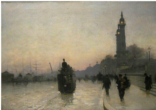
Figure 3- « Les quais de Bordeaux », Alfred Smith, musée des beaux-Arts, mairie de Bordeaux, photo F. Deval, Bx E 921