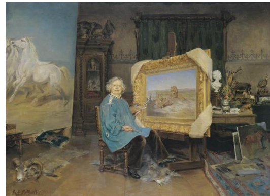
Figure 4- « Rosa Bonheur dans son atelier », Georges Achille-Fould, musée des Beaux-Arts, mairie de Bordeaux, photo L. Gauthier, Bx E 946

Les artistes sont des peintres des XIXe et XXe siècles, du fait des œuvres accessibles à l'intérieur du musée des Beaux-Arts. Cette limite chronologique permet néanmoins d'introduire de nombreux éléments culturels relevant de l'architecture, des mœurs, des paysages, des courants artistiques, etc., ainsi qu'une diversité de formes et de couleurs possédant des variations en termes de structuration, de détails, etc. (annexe 2).