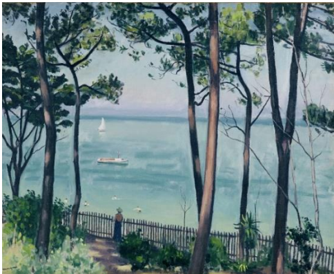
Figure 1- « Jardin au Pyla », Albert Marquet, musée des Beaux-Arts, mairie de Bordeaux, Bx 1960.4.14