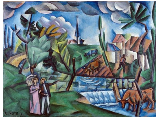
Figure 2- « Paysage français », André Lhote, musée des Beaux-Arts, mairie de Bordeaux, Bx 2006.1.5