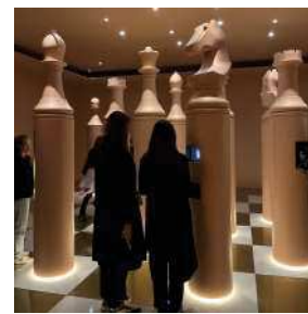
Jeu d'échecs géant interactif