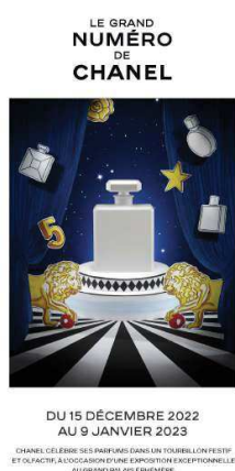
Affiche promotionnelle du Grand Numéro de Chanel

De son côté, Chanel présente son événement par d'autres couleurs telles que l'or, symbole de puissance, de lumière et d'opulence, mais également par du blanc, symbole d'innocence et de lumière, et du rouge vif ajoutant une touche d'audace. Ces affiches jouent sur le mystère avec une absence d'éléments concrets sur ce que les expériences vont contenir, elles proposent également toutes les deux des couleurs pouvant renvoyer à un univers onirique et somptueux, et des signes correspondant à leurs propres récits.