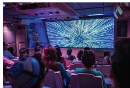
Attraction Star Tours, Disneyland Paris