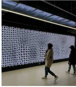
Écran interactif, LV DREAM