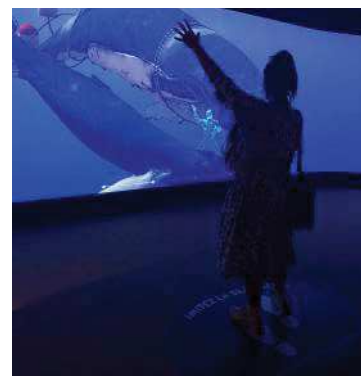
Aquarium Tropical, Palais de la Porte Dorée

Comme précédemment démontré en introduction, Paris a ainsi vu émerger plusieurs centres d'art immersif tels que l'Atelier des Lumières, Jam Capsule ou encore Le Grand Palais Immersif, ainsi qu'une multiplication d'offres d'expériences immersives dans trois domaines : les rétrospectives d'artistes, les thèmes scientifiques et les oeuvres cinématographiques. Nous avons également rappelé leur grande popularité. L'art immersif semble donc être une tendance culturelle en pleine expansion, et certaines marques de luxe ne cachent pas leur volonté de continuer à s'inspirer du monde de la culture en proposant également des dispositifs d'immersion expographique, sensoriels ou technologiques. Nous distinguons ainsi deux offres : celles des marques proposant des installations artistiques immersives en point de vente, et celles des marques proposant des expositions-expériences immersives.