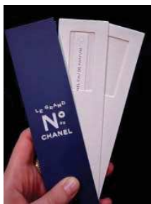
Collection de mouillettes