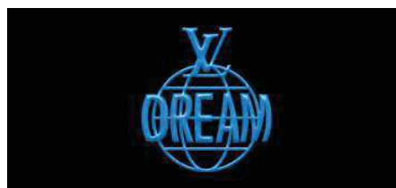
Affiche promotionnelle de LV DREAM par Louis Vuitton