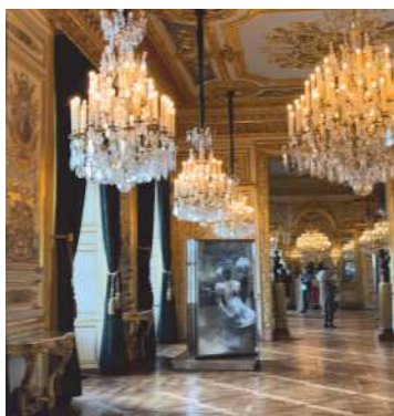
Hôtel de la Marine, Place de la Concorde