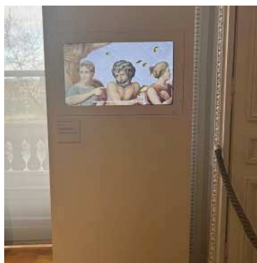
Exposition L'ArtGent dans l'Art, Monnaie de Paris

Ministre de l'Éducation nationale et de la Jeunesse de l'époque, Pap Ndiaye, où le corps numérique du visiteur est immergé dans l'océan afin d'essayer de sauver les baleines des filets de pêcheurs.