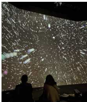
Écran 360 : tourbillon galactique, Exposition Eternel Mucha

Lors de nos analyses, nous avons pu remarquer que cet effet d'absorption était systématiquement créé par un rituel d'entrée précis, plongeant entièrement le visiteur dans l'univers souhaité, au coeur d'une autre dimension. Lors de la visite de l'exposition Eternel Mucha, le visiteur est dès la première salle immergé dans un écran géant. La première image qu'il lui est offerte est un fond noir de galaxie d'où jaillit un tourbillon de particules blanches, créant un effet d'optique et immergeant instantanément le visiteur dans l'écran. Selon Jullier, ce type d'image de synthèse a pour objectif de faire « rentrer dans l'image » 163 le visiteur. Le qualificatif « immersif », est associé à « un effet d'absorption, {...} ce type de présentation rappelle les systèmes Omnimax, Imax, ou encore les planétariums qui complètent l'offre des musées » 164 . Cet effet d'optique pourrait également rappeler certaines attractions de parc à thèmes ou de fête foraines où les visiteurs entrent dans des simulateurs :