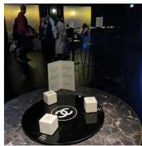
Verres contenant les parfums Bleu