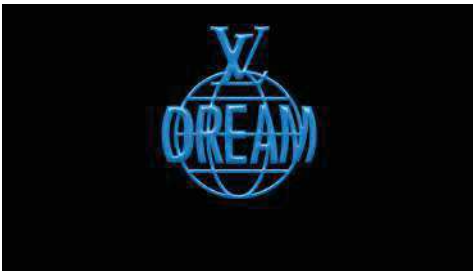
Image print, type dessin 3D avec perspective, épuré, fond noir, écriture bleue en premier plan

Logo LV posé sur le haut d’un globe terrestre non rempli, aux contours bleus, où seules les lignes imaginaires sont dessinées en bleu