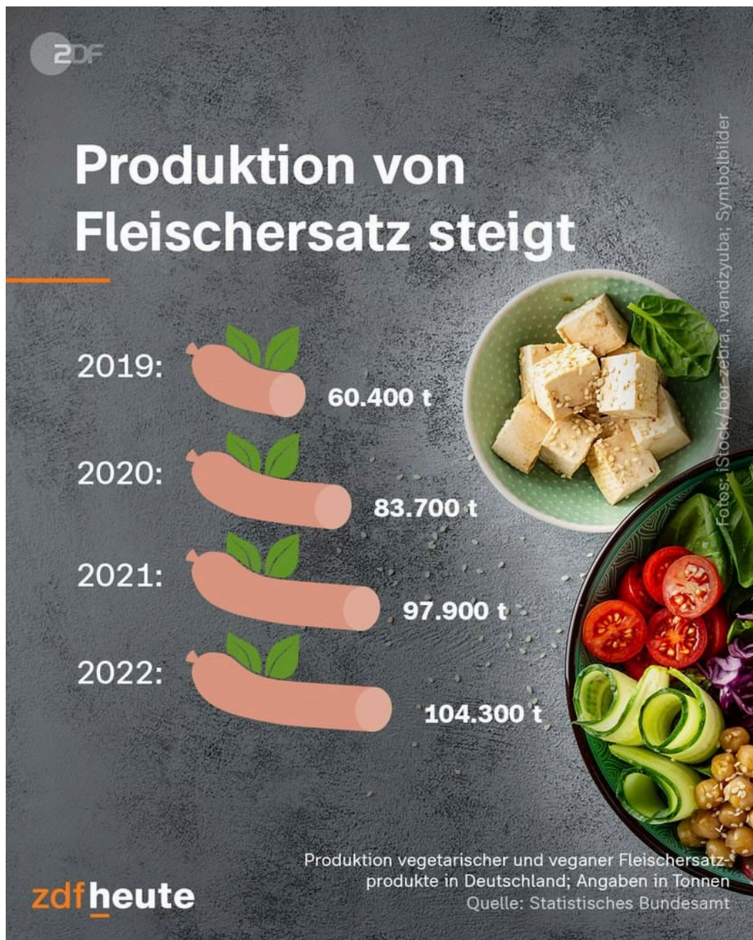
Abbildung 2: „Produktion von Fleischersatz steigt“, ZDF heute, 10. Mai 2023.

Eine Veröffentlichung vom 10. Mai 2023 von ZDF heute - auf dem Instagram-Account von ZDF heute - zusammen mit der obigen Abbildung 2, gibt uns die Entwicklung dieser Zahlen für die Jahre 2021 und 2022. Laut Statistischem Bundesamt steigen die Fleischalternativen in den letzten beiden Jahren weiter an, von 83,7 Tonnen im Jahr 2020 auf 97.900 Tonnen im Jahr